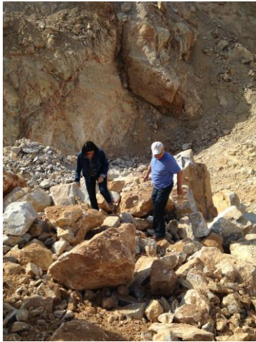
Şekil 2.2a. Elmacık Köyü mevki taş ocaklarından numune alımı