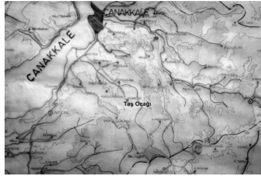
Şekil 2.1b. Taş ocağının yerini gösteren harita