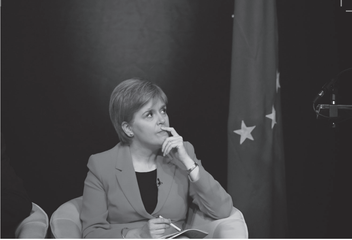
Sturgeon would have to overcome many hurdles before she could arrive in Brussels to present a membership application

vuran ülkeler gibi aday pozisyonunda değerlendirecek fakat demokrasi ve ekonomik durumu açısından şartlar oldukça iyi gözüküyor.