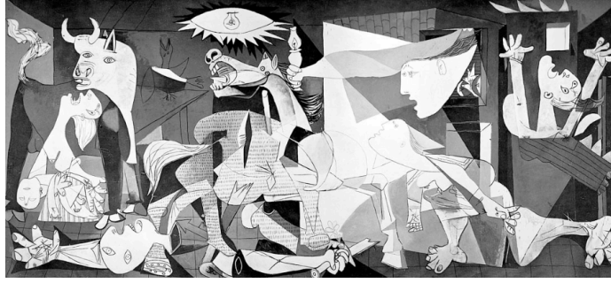
Görsel 1. Picasso, Guernica , 1937, Tuval Üzerine Yağlıboya, 349 cm x 776 cm, Museo Reina Sofia, Madrid.