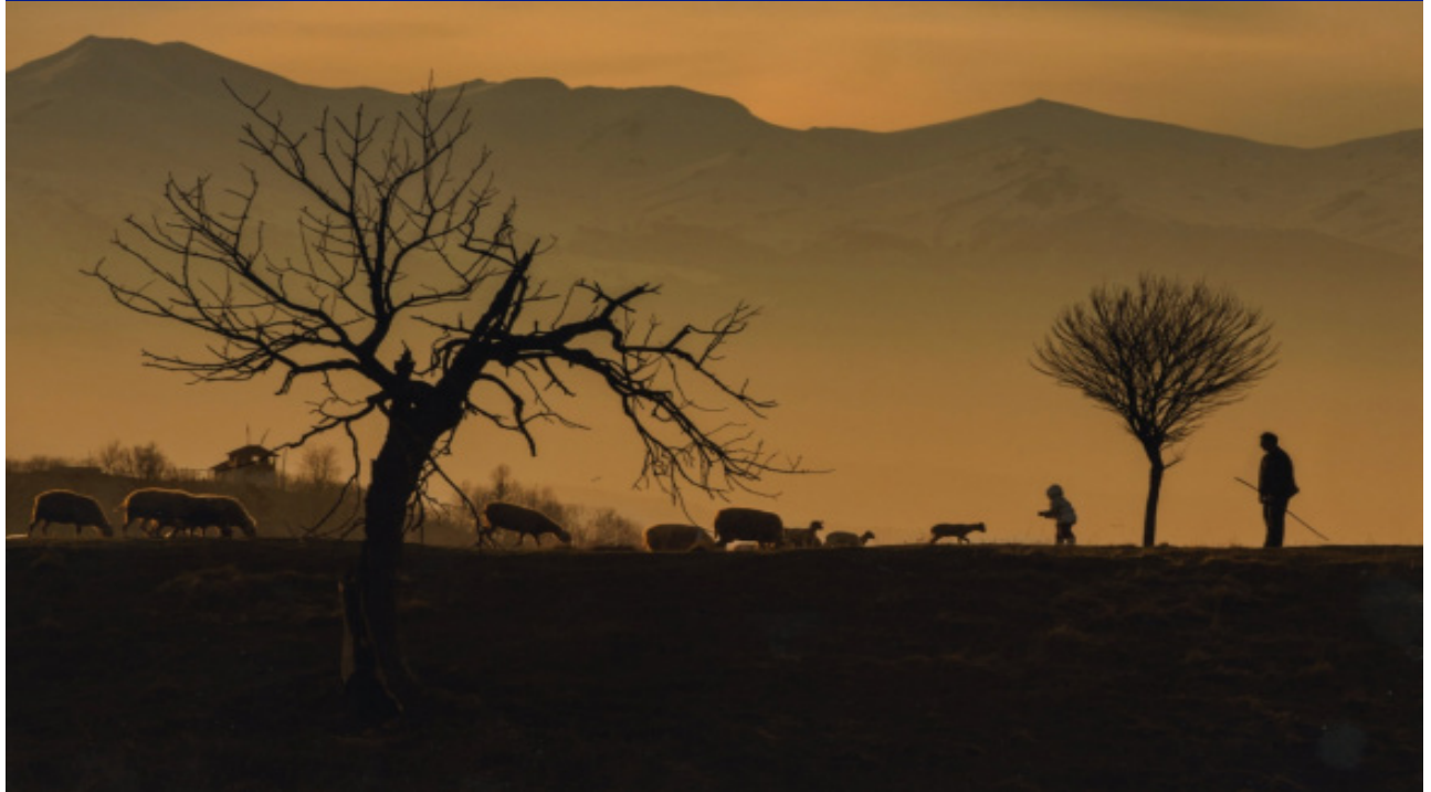
Kapak Fotoğrafı: "Uludağ'ın Eteğinde Yaşam" Sağlık Memuru Hasan Yaşar, TTB-STED Fotoğraf Yarışması 2013 Juri Özel Ödülü