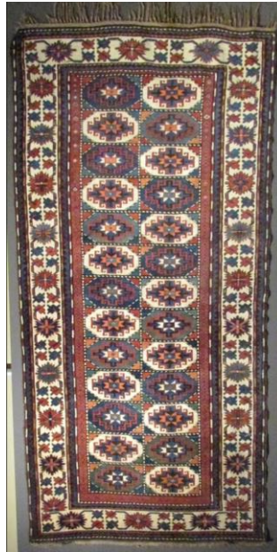
Foto 11:Muğan Halısı, Karabağ Grubu 20.yyöncesi, Azerbaycan Bakü Müzesi.

1.1. Türkmen Gülü Motifi: Bazı kaynaklarda Türkmengülü, Türkmen aynası veya Ejder motifi olarak adlandırılan motife Anadolu'da özellikle Kars, Ağrı, Muş, Bitlis, Erzurum, Malatya, Adıyaman, Elazığ ve Tunceli'nin köylerinde rastlamak mümkündür. 6 Azerbaycan'ın da birçok bölgesinde sık kullanılan bir motiftir. Motif sekizgenler içerisinde yer alan çengel basamaklardan oluşan ve ortasında yine sekiz köşeli yıldız bulunan bir tasarıma sahiptir. Bazı halıların zemininde büyük boyutta ve sıralı olarak kullanılırken, bazı halılarda ise küçük boyutta sıralı ve yan yana getirilerek kompozisyonlar oluşturulur. Motifin Anadolu, Kafkas ve Türki Cumhuriyetlerde ortak kullanılan bir motif olduğu düşünülmektedir.