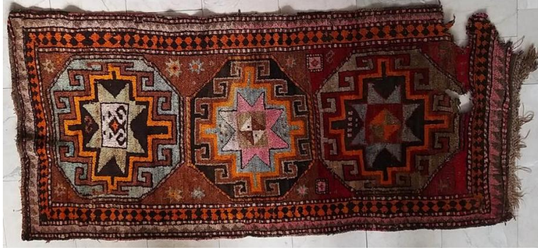
Foto 12: Ardahan-Merkez, Hasköy Camii, 20.yy'ın ilk çeyreği, Kars Etnografya ve Arkeoloji Müzesi.

1.2. Buta Motifi: Azerbaycan bölgesinde Buta motifi olarak adlandırılan ve birçok çeşidi olan motif İran'da da sık kullanılan bir motiftir. Zaten aynı motif Yurdumuzda da özellikle kumaş süslemelerinde kullanılan “şal” motifi olarak bilinmektedir. 7 Kars ve Iğdır bölgesinde nadir de olsa halılarda görülen motifin Tebriz halılarında çok sık kullanıldığı bilinmektedir.