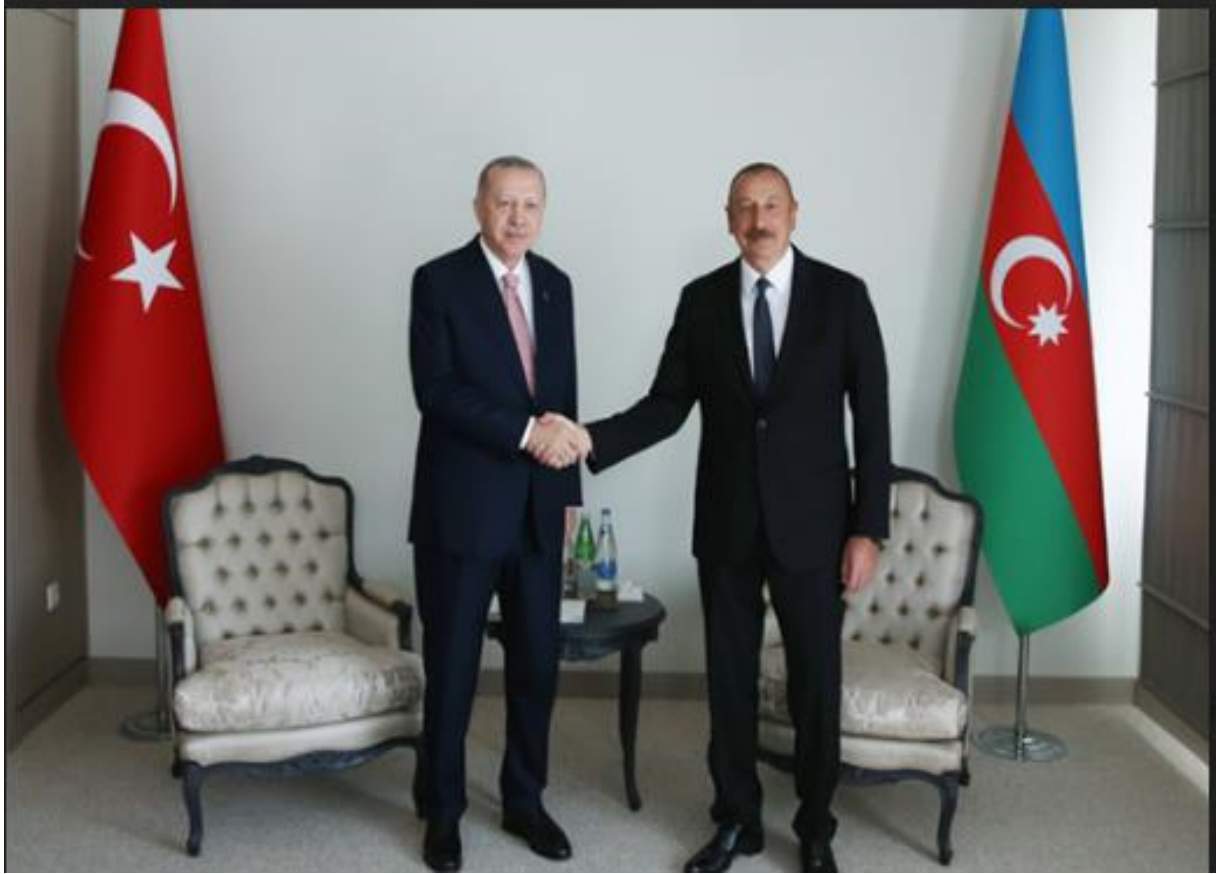
Türkiye Cumhurbaşkanı Recep Tayyip Erdoğan ve Azerbaycan Cumhurbaşkanı İlham Aliyev