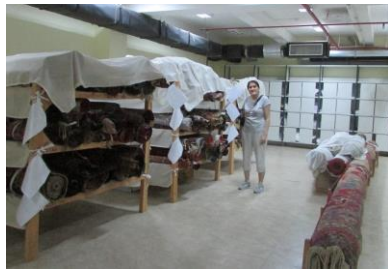
Foto 1-2: Azerbaycan Milli İncenanatMüzesi. Bakü,Depoİncelemesi, Bakü, 2019.