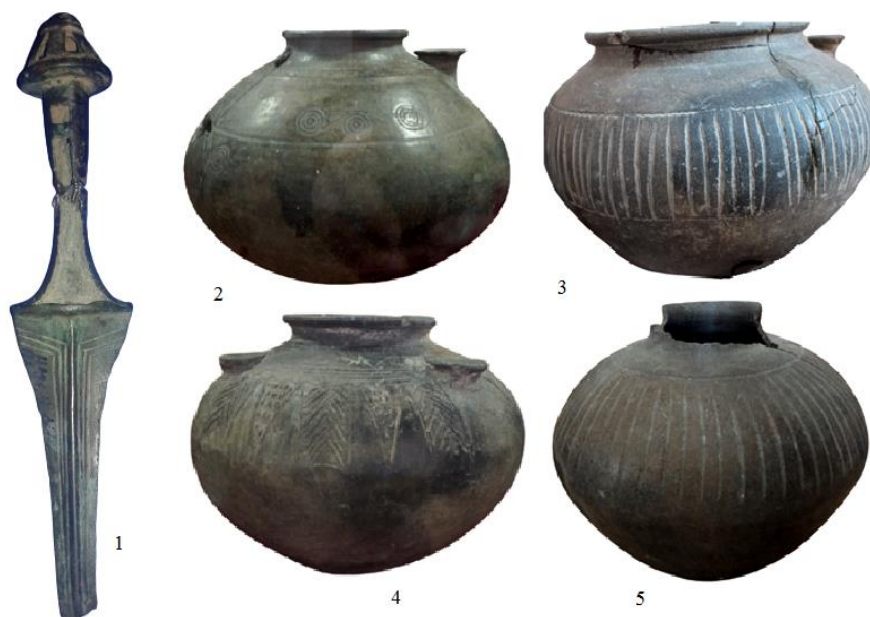
Şəkil 1. Naxçıvanda KI Son Tunc-Erkən Dəmir dövrü abidələrində aşkar olunan Xocalı-Gədəbəy tipli arxeoloji materiallardan nümunələr.