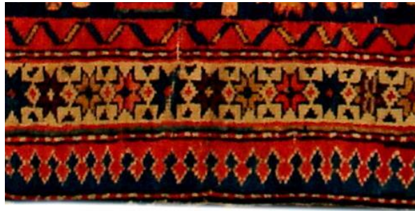
Foto 26:Env. No: T-332, Pirebedil Halısı Kuba, 19.yy, Ok Motifi Detayı,Azerbaycan İnce Senet Müzesi.