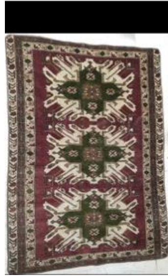
Foto 46:Çelebi Halısı, Bakü Halı Müzesi Foto 47: Kars Halısı, 19.yy Kars Müzesi

3.4. Ejderha Motifli Halılar: Kars bölgesinde Ejderha deseni olarak adlandırılan motiflerin yer aldığı halılardır. Bu motifler genellikle sekizgen göller içerisine yerleştirilmiştir. “Bu halılara sekizgenlerin çevresindeki kıvrımlı desenlerden dolayı, “kuyrumlu” diyenlerde