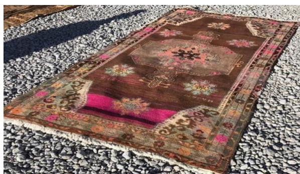
Foto 33: Kars Halısı, Bereket Halı. Koleksiyonu