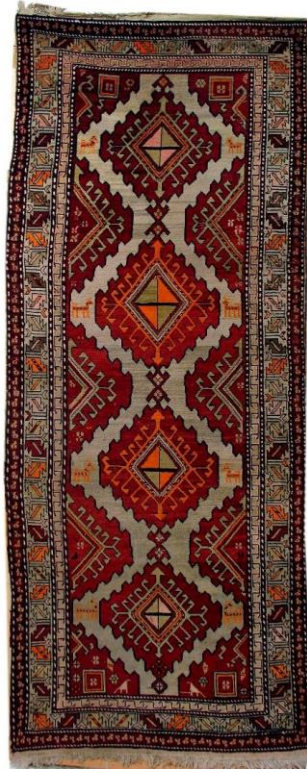
Foto 27: “Açma-Yumma” Karabağ Halısı, 19.yy, Azerbaycan İnce Senet Müzesi.

2.1. Zikzak Madalyon Kompozisyonlu: Azerbaycan Karabağ bölgesinde daha çok karşımıza çıkan halı kompozisyonuna bölgede “Açma-Yumma” (açılma ve kapanma) denmektedir. Zikzak madalyonların halının orta zemininde bütün olarak, zeminin sağ ve solunda ise yarım olarak art arda sıralanmasından oluşan bir kompozisyona sahiptir. Azerbaycan bölgesine ait olan halı kompozisyonuna Kars bölgesinde de rastlanmaktadır.