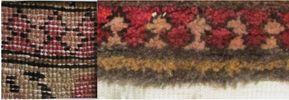
Foto 24-25: Ok Motifi, Tuzluca Buta desenli halının sırt detayı ve ön detay, (Fotoğraf Esen Baydemir).

1.4. Ok Motifi: Azerbaycan da “Molla başı” olarak adlandırılan motif Kafkas halılarının temel özelliğidir. Motif genel olarak halıların suyolu (sedef) denilen ince bordürlerinde kullanılmaktadır. Kars ve İğdir bölgesindeki halılarda sıkça görülmektedir. Kars bölgesinde ise genel olarak ok motifi olarak adlandırılmaktadır.