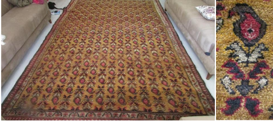
Foto 19-20:Buta Motifli Halı- Detay, Iğdır, Tuzluca, Aşağı Mahalle, (Fotoğraf Esen Baydemir).

1.3. Lanset Yaprak (Testere Dişli Yaprak) Motifi: Lanset yaprak motifi Kars ve Azerbaycan halılarında sık görülmektedir. Lanset yapraklı bordür deseni (Bu motife Anadolu da testere dişli yaprak motifi, çınaryaprağı motifi de denmektedir.) Şirvan, Lehistan, Kazak, Milas, Balıkesir, Çanakkale- Ezine, Kars ve Kafkas halılarında bolca görülmektedir. 8 Bu desen köken olarak Kafkas bölgesine ait olmasına rağmen Anadolu'da bolca kullanılmıştır. Geniş bir coğrafyada yaygın olarak kullanılan motif Kars ve Iğdır bölgesinde bulunan halıların özellikle bordürlerinde sıkça karşımıza çıkmaktadır.