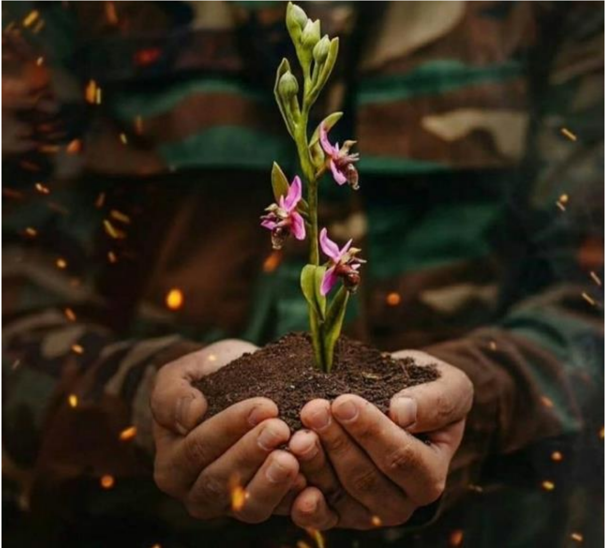
Yalnız Şuşa'da yetişen nadir çiçek Xarıbülkül https://www.google.com/search?