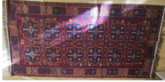
Foto 40: Kars Yıldız Halı koleksiyonu, Şirvan Halısı 20.yy, (Fotoğraf Esen Baydemir).

3.2. Lesghi Yıldız Motifli Halılar: Bazı bölgelerde Hun gülü, TürkmenGülü olarak adlandırılan, sekizgen köşeli yıldız motifi; Kars, Bakü, Şirvan, Kafkasya bölgesinde “Lasghi Yıldızı” olarak bilinir. Şirvan halılarında yaygın şekilde görülen ve Doğu Anadolu halılarında da yer alan yıldız madalyon motiflerinin özellikle Kars ve Iğdır bölgesinde sık kullanıldığı görülmektedir. Bu kompozisyonlarda da büyük sekiz köşeli yıldız motifleri art arda sıralanmaktadır. Ayrıca zemindeki boşluklar çeşitli geometrik motifler ve çiçeklerle doldurulmuştur. Bu tasarımın da bire-bir Kars bölgesinde kullanıldığı gözlenmiştir. Ayrıca Kars, Iğdır ve Ağrı bölgelerinde bu kompozisyona sahip halılarda bazen yıldız motifinin sıralandığı zeminin boş bırakıldığı görülür. Renk olarak kırmızı ve koyun yününün tabii renklerinin ağırlıklı olarak kullanıldığı görülmektedir.