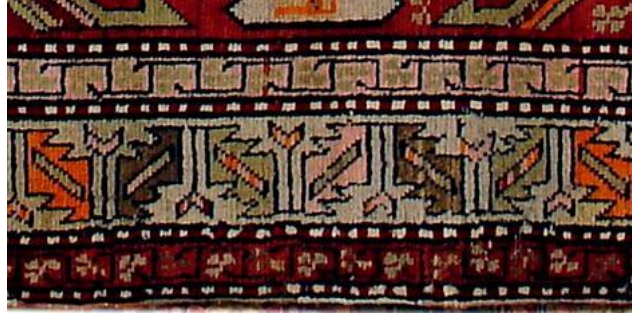
Foto 22:Env.No. T-903, Karabağ Halısı Bordür Detayı, 19.yy, Azərbaycan İnce Senet Müzesi.

1.4. Ok Motifi: Azerbaycan da “Molla başı” olarak adlandırılan motif Kafkas halılarının temel özelliğidir. Motif genel olarak halıların suyolu (sedef) denilen ince bordürlerinde kullanılmaktadır. Kars ve İğdir bölgesindeki halılarda sıkça görülmektedir. Kars bölgesinde ise genel olarak ok motifi olarak adlandırılmaktadır.