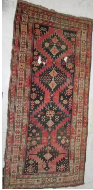
Foto 28: Kars, Karabağ Halısı, 19.yy, Kars Arkeoloji Müzesi.

2.2. Geometrik Göl Motif Kompozisyonlu: Zeminde geometrik göl motiflerinin art arda sıralandığı ve aralarının yan yana sıralı üç adet kare motiflerle doldurulduğu bir kompozisyona sahip olan halı Azerbaycan halısı olarak bilinmektedir. Kars Müzesinde bulunan 1972 yılında müze envanterine kaydedilmiş halının Şirvan civarında dokunduğu bilgisi yer almaktadır. Daha kaba kalite örneklerinin Kars bölgesinde de dokunduğu görülmektedir. 9