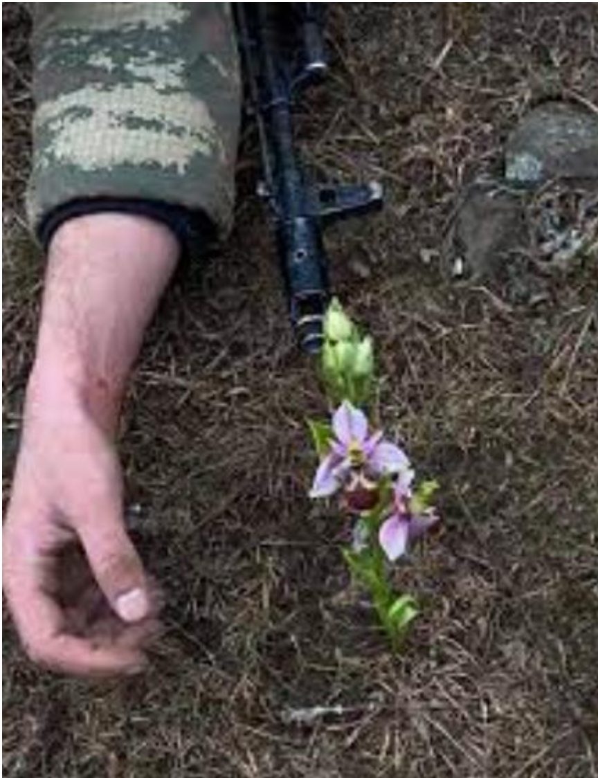
Xarıbülül uğruna can veren şehitler