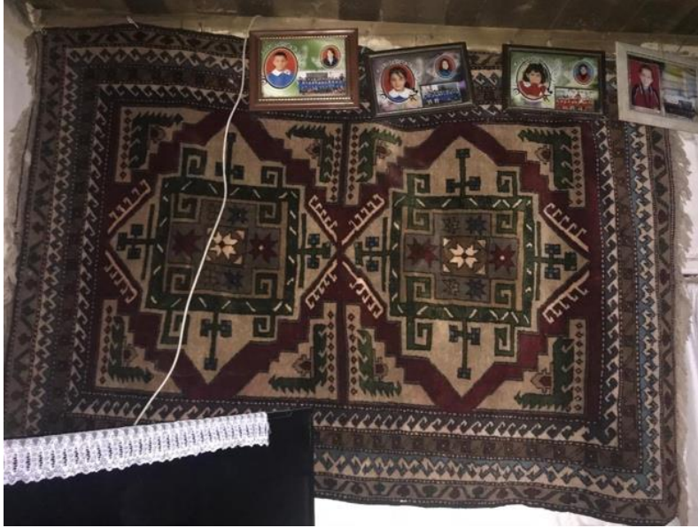
Foto 10: Halı Örneği, Kars – Sarıkamış İlçesi Alisofu Köyü.

İstanbul'da bulunan ve Kars halılarını uzun yıllar toplayıp ticaretini yapan Bereket Halı firması sahibi Celalettin Vardarsuyu ile görüşülmüş, mağazada yer alan 6 adet Kars halısı fotoğraflanmıştır. Ayrıca Bereket Halı'nın Antalya Döşeme altı'nda yer alan depolarındaki Kars halılarından 57 adedinin fotoğrafına ulaşılmıştır. Celalettin Vardarsuyu ile yapılan görüşmede bu halılar hakkında bilgi edinilmiştir.