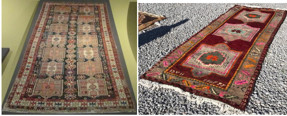
Foto 30:Bakü Halısı, Bakü Grubu, 20.yy öncesi, Foto 31:Üzerinde "Hacı 1983" tarihi yer alan Bakü Halı Müzesi Kars Halısı, Bereket Halı Koleksiyonu.

2.3. Tek Madalyon Kompozisyonlu: Kars yöresinde zeminde tek büyük madalyonların yer aldığı kompozisyonlar çok görülmektedir. Bu madalyonların bazıları bitkisel bazıları geometrik motiflerle oluşturulmuştur. Halı zemininin köşelerinde de çeyrek madalyon benzeri bezemeler yer almaktadır. Kompozisyonun daha detaylı ve motifler açısından daha zengin örnekleri Azerbaycan halılarında görülmektedir. Azerbaycan'da "Qımıl" olarak adlandırılan halılara İran'ın Azeri nüfusunun yoğun olarak yaşadığı Güney Azerbaycan bölgelerinde de rastlanmaktadır. Bölgede bu halılara Gömüllü adı verilmektedir. 10 Bölgede bulunan halılar ve Kars-Arpaçay da bulunan halılarda kırmızı zemin rengi dikkat çekmektedir.