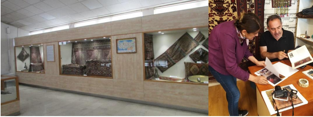
Foto 6-7: Kars Arkeoloji ve Etnografya Müzesi Foto 8-9: Kars Yıldız Halı sahibi Bülent Yıldız ile halı karşılaştırmaları üzerine çalışma