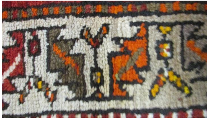
Foto 21: Kars Halısı Bordür Detayı, Sarıkamış Şehit Halit Köyü Camii, 20.yybaşı, (Fotoğraf Esen Baydemir).

1.3. Lanset Yaprak (Testere Dişli Yaprak) Motifi: Lanset yaprak motifi Kars ve Azerbaycan halılarında sık görülmektedir. Lanset yapraklı bordür deseni (Bu motife Anadolu da testere dişli yaprak motifi, çınaryaprağı motifi de denmektedir.) Şirvan, Lehistan, Kazak, Milas, Balıkesir, Çanakkale- Ezine, Kars ve Kafkas halılarında bolca görülmektedir. 8 Bu desen köken olarak Kafkas bölgesine ait olmasına rağmen Anadolu'da bolca kullanılmıştır. Geniş bir coğrafyada yaygın olarak kullanılan motif Kars ve Iğdır bölgesinde bulunan halıların özellikle bordürlerinde sıkça karşımıza çıkmaktadır.