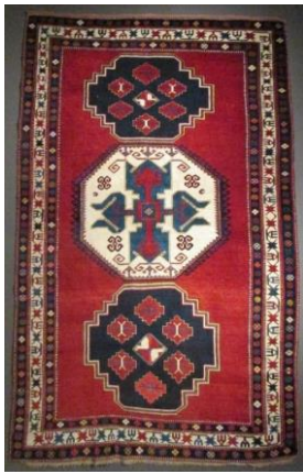
Foto 49:Qazak Borçalı Halısı 20.yy öncesi, (Fotoğraf Esen Baydemir)

vardır. 12 Azerbaycan Gence-Qazak Borçalı bölgesinde görülen bu halılara Lori-Pambak adı verilmektedir. Sekizgenlerin içerisinde yer alan ejder motifi olarak adlandırılan motiflere ise haç damga motifi denmektedir. Bu halılar motif ve kompozisyon olarak Azerbaycan bölgesinde dokunan halıların özelliklerini taşımaktadır ve Kars bölgesinde bulunan örneklerinde bire-bir motif özelliklerinin korunduğu tespit edilmiştir.