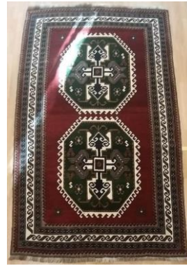
Foto 50: Kars Halısı, 1989-90 Bakü Halı Müzesi. Kars Yıldız Halı Koleksiyonu.

3.5. Sekizgen Göllü Halılar: Azerbaycan'ın Karabağ bölgesine ait bu tür halının orta zemininde sekizgen göller, zemini kaplayacak şekilde art arda sıralanmaktadır. Kompozisyonda yer alan göl sayısına göre, beş göllü veya üç göllü olarak adlandırılır. Kars bölgesinde ise bu halılara Terekeme halısı denir. Kars bölgesinde bulunan örneklerde kompozisyon ve desen özelliklerinin de korunduğu gözlemlenir. Azerbaycan halılarında daha canlı renkler görülürken Kars bölgesinde bulunan örneklerde ise daha çok koyun yününün tabii renkleri ve kahverengi tonları yer almaktadır. Ayrıca bu halının bir örneği Bitlis Şerifiye Camiinde bulunmaktadır. Yine bu bölgedegöl olarak adlandırılan motife sofralık motifi denilmektedir. Göl motifinin benzerlerine Kars ve Iğdır bölgesinin halı yastıklarında da rastlanmaktadır.