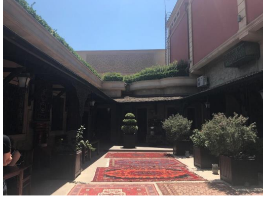
Foto 4-5: Azer İlme Halı Atölyesi, Bakü, 2019.