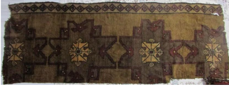
Foto 45:İğdirHalfeli Köyü Halı Parçası, 1989, Dokuyucu Adile Yanık, (Fotoğraf Esen Baydemir)

3.3. Çelebi Halıları: Bu halı ismini Azerbaycan'ın Karabağ bölgesi Berde reyonuna (bölge) bağlı Çelebi köyünden almıştır. Latif Kerimov'a göre Çelebiköyü bu halının dokunduğu ilk merkezdir. 11 Halı kompozisyonunu zemini kaplayacak şekilde yer alan ve art arda sıralanan madalyonlar oluşturmaktadır. Bu madalyonlara Azerbaycan'da göl adı verilmektedir. Bu tür halılara Kars bölgesinde de sık sık rastlanmaktadır. Bölgede dokunan halıların desen özelliklerini bire-bir koruduğu tespit edilmiştir.