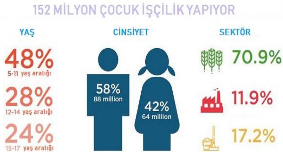
Şekil 2: Dünyada Çalışan Çocukların 2012-2016 Yıllarında Yaşa, Cinsiyete ve Sektörlere Göre Dağılımı

ILO'nun 2012-2016 Çocuk İşçiliği ile Mücadele Programı (International Programme on the Elimination of Child Labour [IPEC]) raporuna göre dünyada 152 milyon çocuk işçi bulunmaktadır ve bunların 73 milyonu tehlikeli işlerde çalışmaktadır. Çocuk işçiliği Afrika'da %19,6, Amerika'da %5,3, Arap ülkelerinde %2,9, Asya ve Pasifik'te %7,4, Avrupa ve Orta Asya'da %4,1 olarak görülmektedir. Bu çocuk işçilerin %48'i 5-11 yaş, %28'i 12-14 yaş ve %24'ü 15-17 yaş grubundadır. Dünyada çalışan çocukların 88 milyonu erkek, 64 milyonu kızdır. Çocukların %70,9'u tarım, %11,9'u sanayi, %17,2'si hizmet sektöründe çalışmaktadır (ILO, 2017).