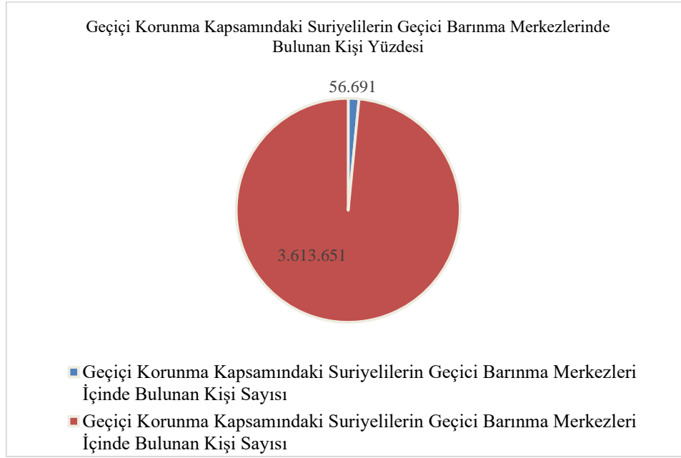
Şekil 1: Geçici korunma kapsamındaki Suriyelilerin geçici barınma merkezlerinde bulunan kişi sayısı