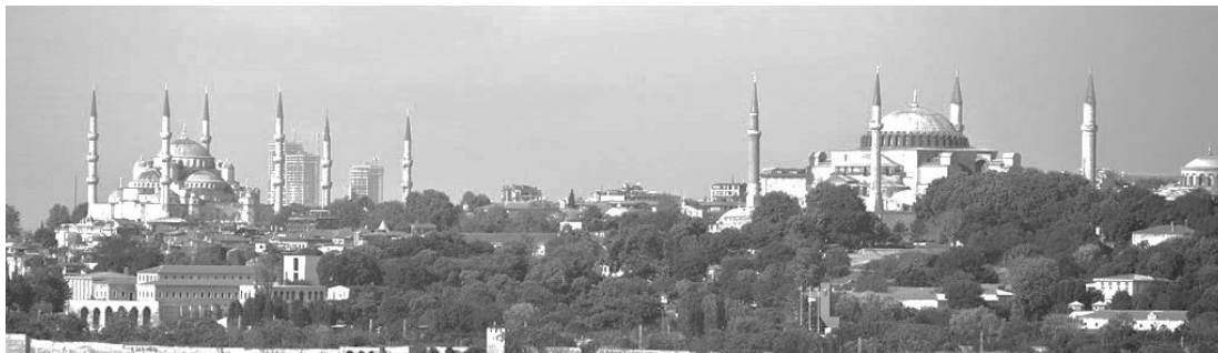
Figure 1. Istanbul's historical skyline and Zeytinburnu 16/9 Towers