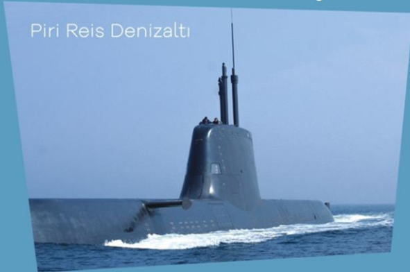
Piri Reis Denizaltı

“2023” Türkiye Yüzyılı'nın Önsözü Olacak