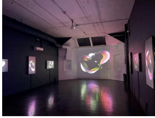
Görsel 7. SuperChief isimli fiziksel NFT galerisinde bir NFT sergisi,

https://research.bitexen.com/post/duenya-nin-ilk-nft-sanat-galerisi-new-york-ta-acildi