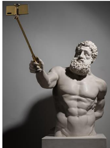
Görsel 8. Sanatçı Emre Yusufi tarafından yapılan 'Divine Selfie' isimli NFT heykel

NFT'ler sanatçıların güçlenmesine ve uluslararası platformlarda tanınmasına fırsat veren bir ortam sunmaktadır. Örneğin SuperChief galerisinde gerçekleşen sergide günümüz popüler hareketi olan selfie kültürüne bir gönderme niteliğinde yaratılan Emre Yusufi tarafından oluşturulmuş ve 'selfie çeken heykel" olarak da bilinen 'Divine Selfie' isimli heykel çalışması NFT olarak 40 Ethereum'a (110 bin dolar) satılmıştır (Webrazzi, 2021).