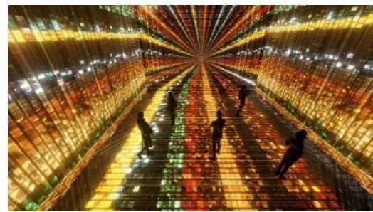
Görsel 1. Sanatçı Refik Anadol’un, “Makine Hatıraları: Uzay” isimli dijital sanat sergisi

https://beyoglu.bel.tr/ana-kategori/beyoglu-sira-disi-sergi-makine-hatiralari-uzay/