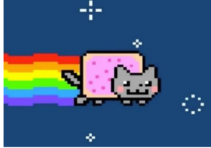
Görsel 3. Sosyal medya "memes" kültürünün en bilinen örneklerinden "Nyan Cat"

görsel NFT olarak satışa sunulmuştur. Benzer şekilde sosyal medya kültüründe 'memes' olarak bilinen işlerinden 'Nyan Cat' NFT olarak hazırlanarak satışa sunulmuş ve 300 Ethereuma satılmıştır. Müzik piyasası içinde benzer durum geçerli olmaktadır. Pop sanatçısı Lindsay Lohan NFT olarak albüm çıkaracağını açıklamıştır. Spor camiasından diğer bir örnek ise NBA'nın maç özetlerini NFT olarak satışa sunması olmuştur.