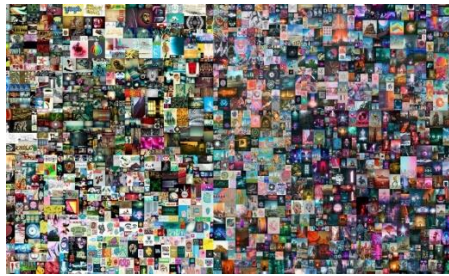
Görsel 4. Beeple NFT, "Everyday: the first 5000 days", https://nftnewspro.com/beeple-nft-arts/

İlk NFT örneği olarak kayda geçen ve 69 milyon dolara satılan sanatçı Mike Winkelmann dijital olarak hazırladığı 1 Mayıs 2007'den itibaren her gün oluşturulan 5000 dijital görselin kolajı olan 'Beeple' isimdeki NFT'dir. Bu eserle birlikte tüm dünya dijital sertifika ile korunan kripto sanat terimi olan NFT ile tanışmıştır. Beeple'in bu rekor satışından sonra tüm sanatçılar NFT ile dijital sanat platformuna dahil olmaya başlamıştır.