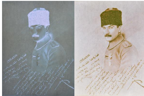
Görsel 6. Dünyada "sanat eseri" tescilli alan ilk NFT'ye dönüştürülen 'Photo1918' isimli imzalı Atatürk fotoğrafı olan NFT, https://www.ntv.com.tr/galeri/n-life/kultur-ve-sanat/dunyanin-sanat-eseri-tescilli-ilk-nftsi-ataturkun-fotografi-oldu,uP2t6BE07k6v1T5n3TbriQ/Yv0aEcQGVUeVR2NjienE6w

Günümüzde müze ve sanat galerileri gibi geleneksel sanat platformlarının dijital dönüşüme ve NFT'lere sıcak baktığı bir gerçektir. Örneğin oldukça popüler ve yükselişte olan NFT eserleri için ABD'de bu konuya özel olarak Seattle NFT Müzesi açılmıştır. Bu müze ile dijital sanatın fiziksel bir mekânda deneyimlenmesi amaçlanmıştır (Artdog, 2022). Benzer bir örnek Newyork'taki SuperChief sanat galerisidir. Bu galeri dünyanın ilk fiziksel NFT galerisi olarak açılmıştır. Galeride yüksek çözünürlüklü ekranlarla sanatçıların NFT eserleri sergilenmektedir. NFT müzeleri ve sanat galerilerinin temelinde dijital eserlerin fiziksel ortamda deneyimlenmesi söz konusu olmaktadır.