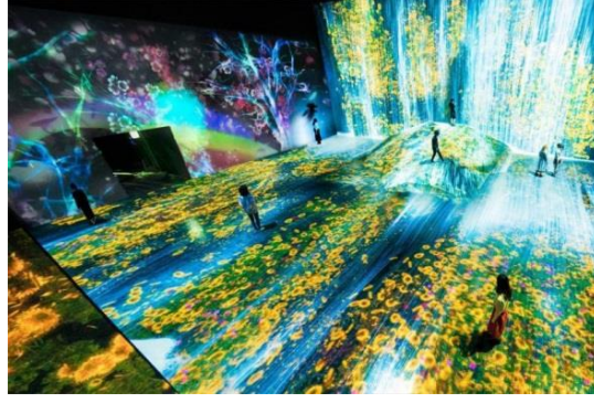
Görsel 2. Tokyo'da gerçekleştirilen dijital sanat sergisi örneği