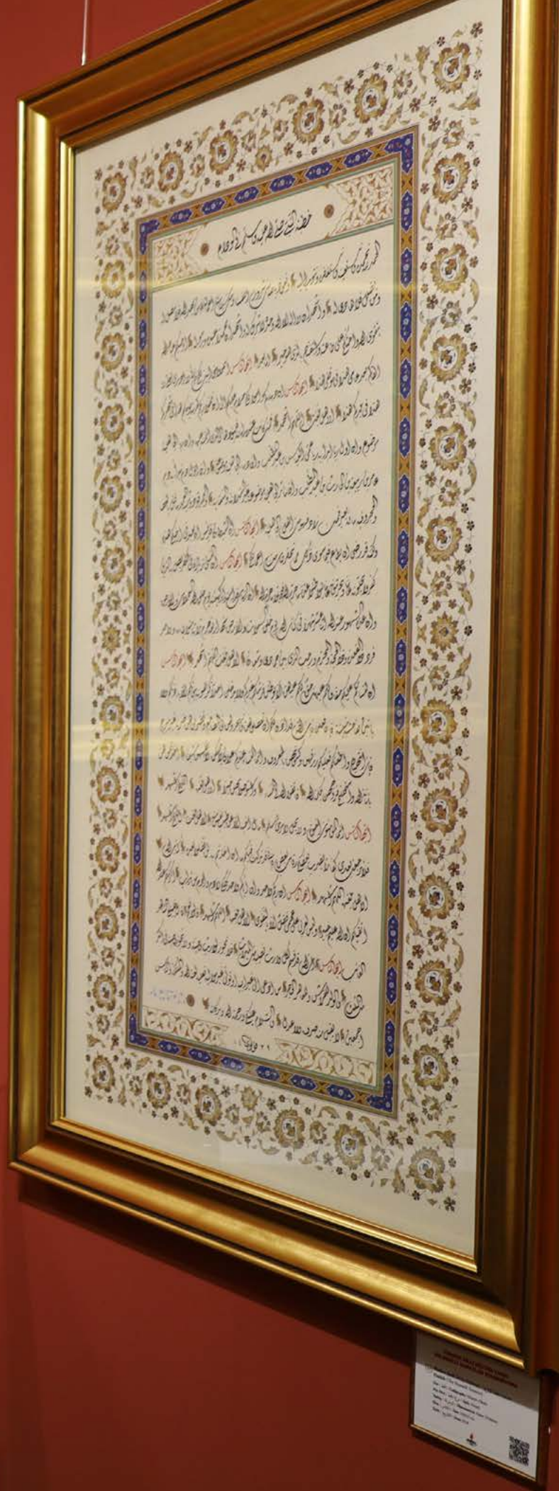
Informational label for the calligraphic manuscript, including a QR code.