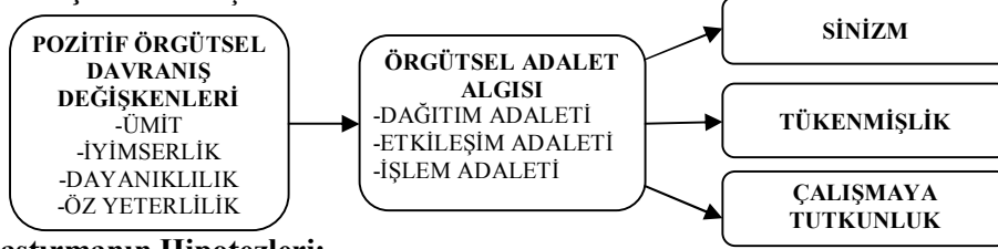
Şekil 1: Araştırmanın Teorik Modeli