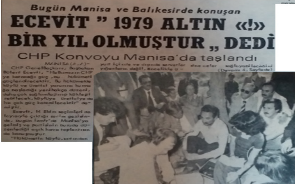
Bülent Ecevit'in 21 Eylül 1979 tarihli Manisa Mitingi ( Telgraf , 22 Eylül 1979, s. 1.)

Manisa CHP Milletvekili adayı Orhan Ayber, 8 Ekim'de Yeni Asır Gazetesi'ne konuşarak, halkın CHP Hükümetinin politikalarını desteklediğini ve AP iktidarında görmediği hizmeti bu dönemde gördüğünü belirtmiştir. Manisa'da ise CHP'nin galip geleceğini, en büyük güvencesinin Manisa halkı olduğunu söylemiştir. Manisa'nın AP'nin kalesi olduğu söylemlerine vurgu yaparak; Manisa'nın herhangi bir partinin değil, hizmet getiren ve sorunları en iyi biçimde çözenlerin kalesi olacağını ifade etmiştir. 49