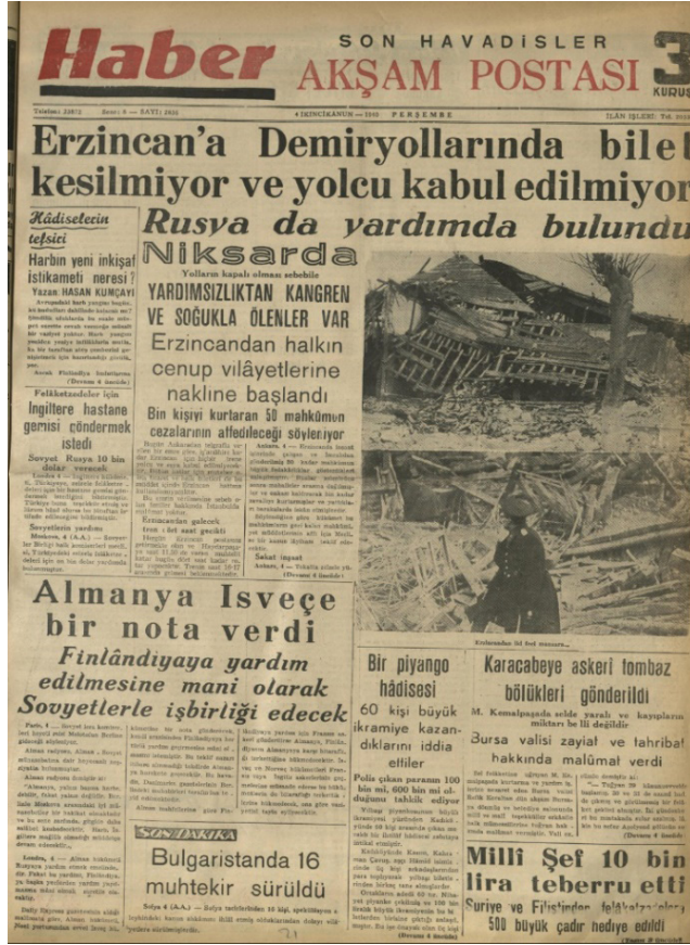
Haber: Son Posta, 4 İkincikânunisanı 1940, s.1.