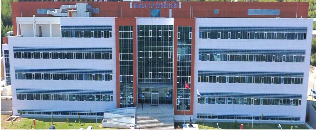
Muğla Sıtkı Koçman Üniversitesi Tıp Fakültesi