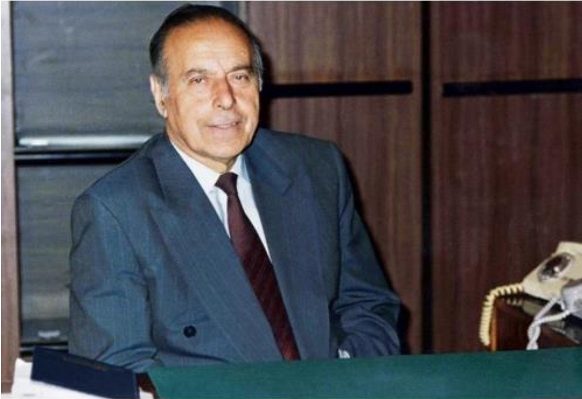
Ulu öndər Heydər Əliyev və Naxçıvan Heydər Əliyev yüksək vəzifələrdə çalışdığı illərdə də Naxçıvanı daim diqqət mərkəzində saxlayıb

Məclisində ölkə sərhədlərinin bərpası, Dağlıq Qarabağ torpaqlarının işğaldan azad olunması məqsədilə komissiyanın yaradılmasının təşəbbüskarı olmuş və Naxçıvan Ali Məclisindən bütün dünyaya Dağlıq Qarabağ həqiqətlərinin çatdırılmasını həyata keçirmişdir. Bütün bunlar Naxçıvanda cərəyan etsə də təbii olaraq Azərbaycanın paytaxtı Bakıda əks-səda doğururdu və ən əsası 1993-cü ilin may-iyun aylarında Azərbaycanda cərəyan edən siyasi hadisələr ölkədə vətəndaş müharibəsini alovlandırmaqla keçid dövründə olan gənc dövlətimizin müstəqilliyini itirmək təhlükəsini reallaşdırdıqda o vaxtın siyasi hakimiyyəti idarəçiliyə qadir olmadığını anlayaraq və xalqın sürəkli tələblərini qəbul edərək Heydər Əliyevi dərin ictimai-siyasi, sosial-mədəni böhranın qarşısını alması, ölkənin idarə etməsi üçün Hakimiyyətə çağırmışdı, daha doğrusu rəhbər işçilər Heydər Əliyevi rəsmən Bakıya dəvət etməyə məcbur olmuşdular.