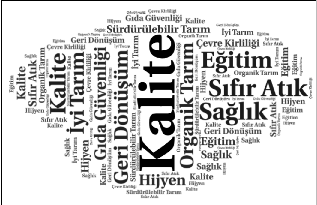
Şekil 1: Yeşil Yönetim Kelime Bulutu

Tarımsal işletmelerin yoğunlaştıkları yeşil yönetim uygulama temaları Şekil 1'deki kelime bulutunda gösterilmektedir. Tarımsal işletmelerin en fazla yoğunlaştıkları yeşil yönetim temalarının kalite, geri dönüşüm, organik tarım, gıda güvenliği, sıfır atık, eğitim ve sağlık olduğu görülmektedir.