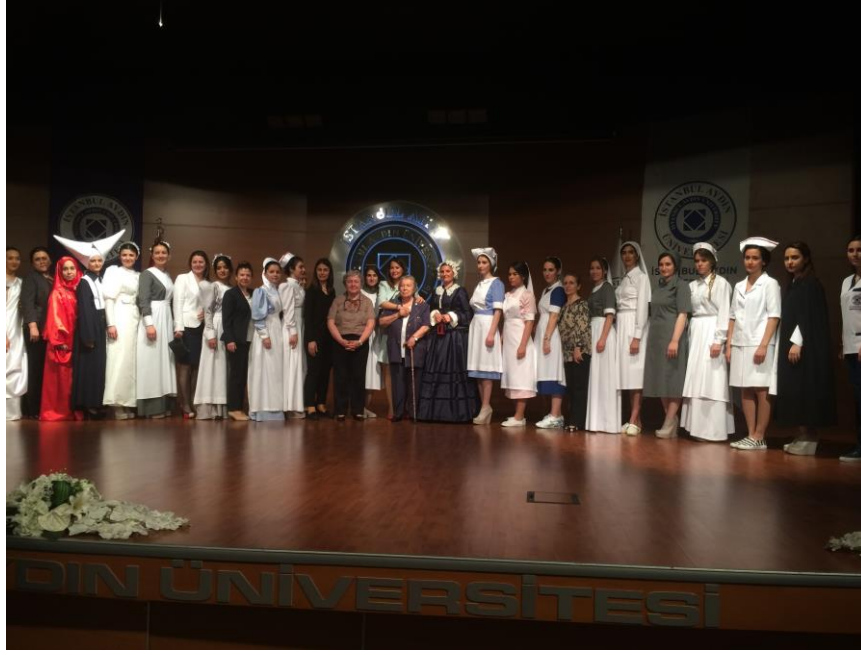
Geçmişten Günümüze Tarihi Hemşirelik Kıyafetleri Defilesi, İstanbul, 2015.