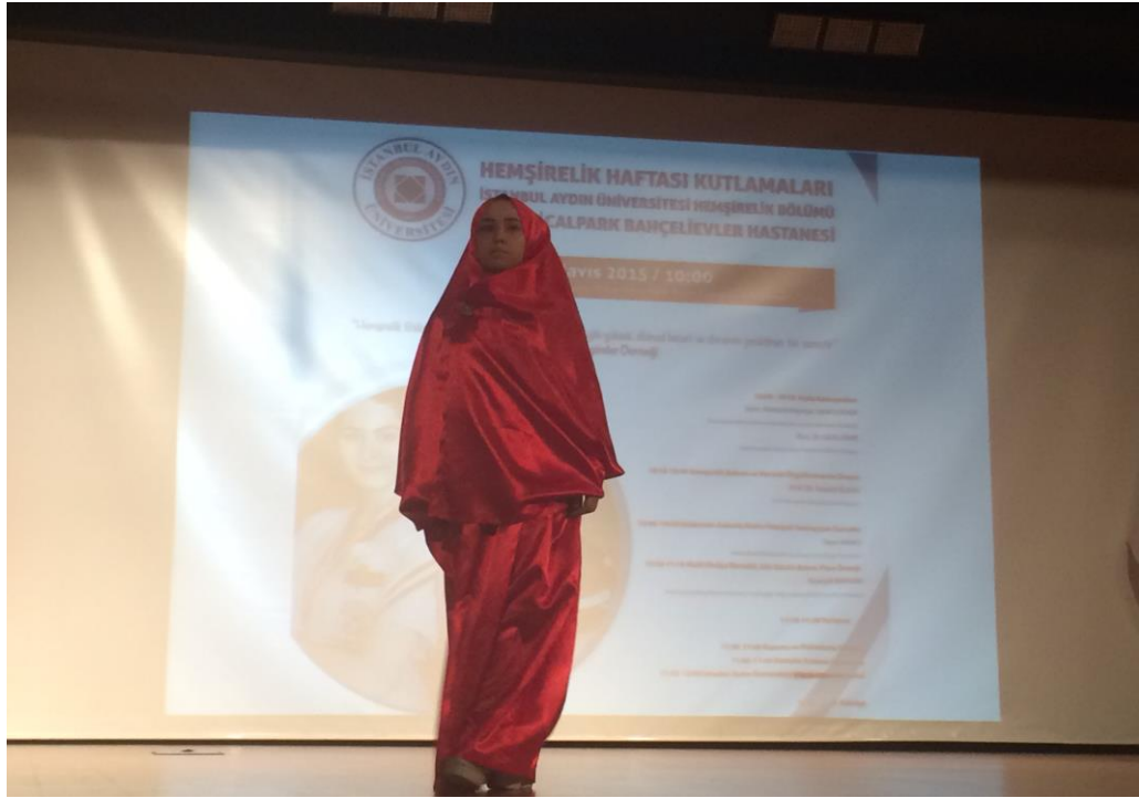
Bilinen ilk dekoneslerden Fabiola: Romalı asil ve zengin bir aileye mensuptur. Evleri tek tek dolaşıp, hastaları kendi evine getirtmiş, evini hastane olarak kullanması ile ün kazanmıştır.