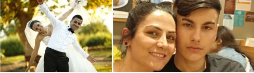
Şekil 1. Kocasından öldürülen eşin evlilik fotoğrafı ve baba tarafından öldürülen anne-oğulun fotoğrafı

Haberlerin sunum şekli ve tarzıyla ilgili olan retorik kapsamında haberlerin çoğunluğunda kurbanlara ait fotoğraflar kullanılırken, bazı haberlerde videolara ve görgü tanıklarından alıntılara yer verilmiştir. Cumhuriyet gazetesinde 3 haberde kurbanı, 3 haberde faile ve 2 haberde ise her ikisinin fotoğraflarına yer verilirken, diğer haberlerde olayın meydana geldiği mekânın görüntüleri sunulmuştur. Sabah gazetesinde 8 haberde kurbanı, 4 haberde faile, 4 haberde olay yeri fotoğraflarına, 4 haberde ise olayla ilgili videolara yer verilmiştir. Bazı haberlerde çiftlerin ve aile üyelerinin mutluluk pozlarını içeren birden fazla fotoğraf kullanılırken (Şekil 1), birkaç haberde kadınların fotoğrafları aynı haber içerisinde sıkça sunulmuş, failerin fotoğraflarına yer verilmemiştir. Diğer yandan, Rus uyruklu bir kadının öldürüldüğü cinayette çok fazla fotoğrafının kullanılması, ilgi çekici bir bulgu olarak karşımıza çıkmaktadır. Bu haberlerde cinayete ilgisi olmayan fotoğrafların kullanımını, olayları bağlamından koparmaktadır.