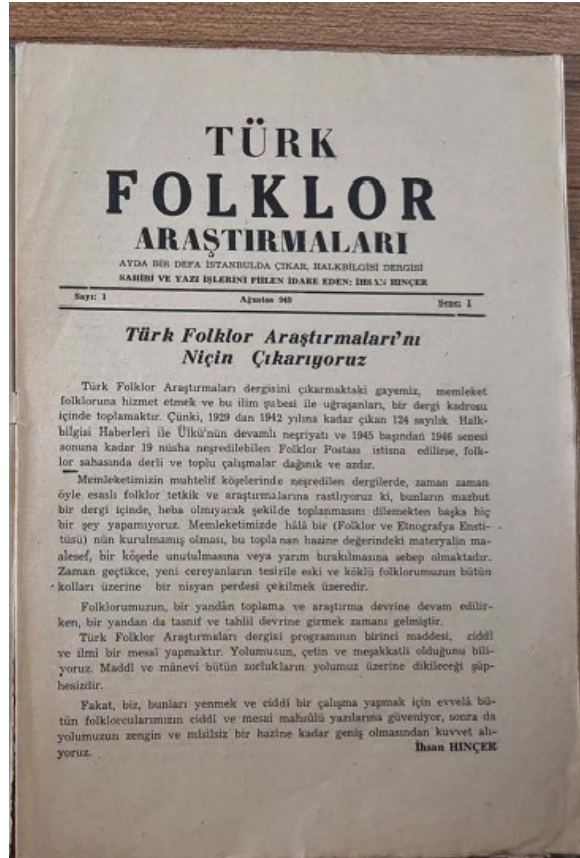
TFA'nın kurucusu merhum İhsan Hınçer'in ilk sayıdaki sunuş yazısı. Ağustos 1949