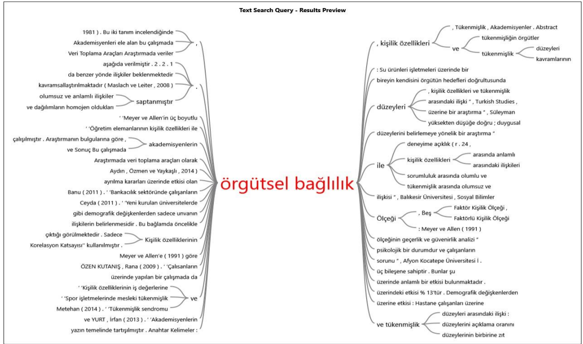
Şekil 2. Kelime Ağacı

Bulut (2017) yaptığı çalışmada örgütsel bağlılıkla kişilik özellikleri ve tükenmişlik ilişkisi değerlendirilmiştir. Çalışmanın kelime bulutuna bakıldığında konu başlıkları olan tükenmişlik, bağlılık ve kişilik kavramları en fazla değinilen kelimeler olurken, konu başlığı içinde olmayan ancak örgütsel bağlılık alan yazımına bakıldığında sıkça değinilen duygusallık kavramı örgütsel bağlılık denildiğinde en çok ön plana çıkan kavram olmuştur.