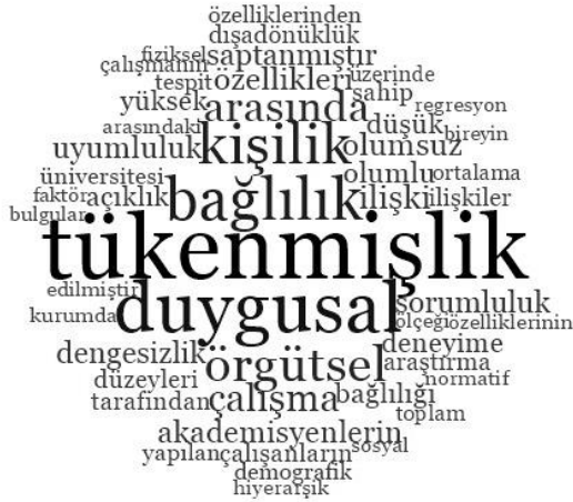
Şekil 1. Kelime Bulutu

Bulut (2017) yaptığı çalışmada örgütsel bağlılıkla kişilik özellikleri ve tükenmişlik ilişkisi değerlendirilmiştir. Çalışmanın kelime bulutuna bakıldığında konu başlıkları olan tükenmişlik, bağlılık ve kişilik kavramları en fazla değinilen kelimeler olurken, konu başlığı içinde olmayan ancak örgütsel bağlılık alan yazımına bakıldığında sıkça değinilen duygusallık kavramı örgütsel bağlılık denildiğinde en çok ön plana çıkan kavram olmuştur.