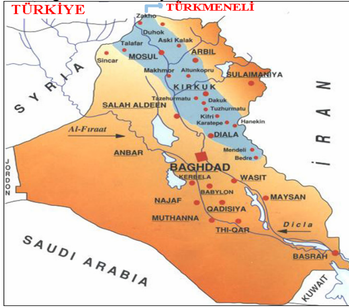
Şekil 1: Irak ve Türkmeneli

Türkmenler genelde Irak’ın, kuzey ve orta bölümlerinde yaşamaktadırlar. Türkmenlerin ezici bir çoğunlukla yaşadıkları vilayetlerimiz şunlardır: Musul, Kerkük, Erbil, Selahattin ve Dilaye vilayetleridir. Başta başkent Bağdat olmak üzere Türkmenler, diğer kentlerde de yaşamaktadırlar.