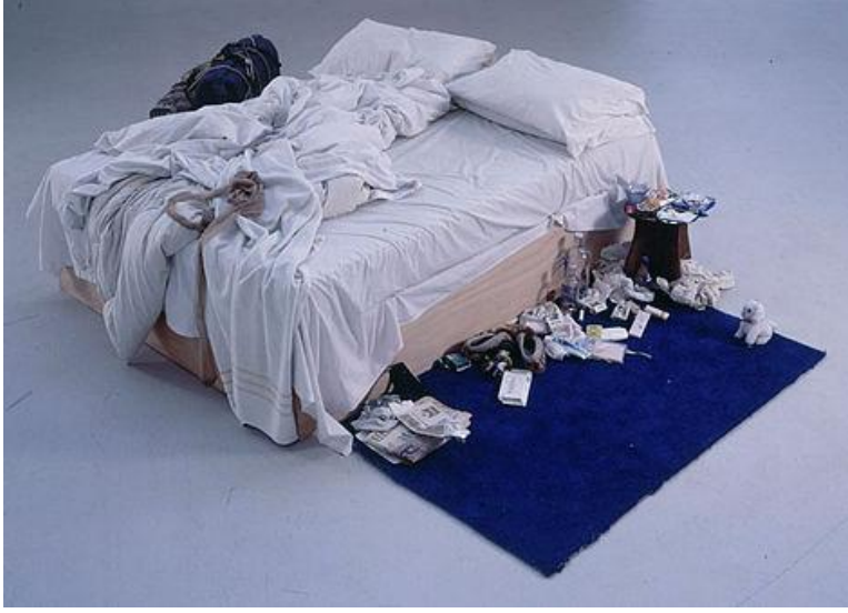
Tracey Emin, My Bed , 1998

akla gelenlerden biri Tracey Emin'in "yapıtlarıdır". Burada Emin'in, My Bed (Yatağım) adlı çalışması anılabilir.