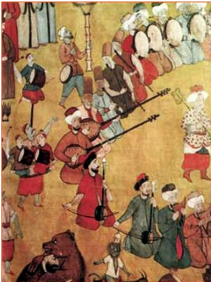
Миниатюра Камолитдин Бехзод под названием “Музыканты” (XV век)

С древних времён красота и сила воздействия человеческого голоса рассматривались как проявление божественного начала. Известно, что стихи священной книги зороастризма «Авеста» читались нараспев. Тексты Корана были переданы пророку Мухаммеду именно напевным голосом. И поэтому все аяты и суры Корана по традиции распеваются приятными голосами, что усиливает их воздействие. Известно, что традиция распева молитвенного призыва «азан» в высоком регистре была начата Хазрати Билолом. Эти и другие факты свидетельствуют о том что, человечество всегда для выражения и передачи своих верований, священных идей, любви к Всевышнему, всех эмоций использовало силу слова и вокальную интонацию.