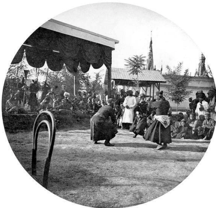
“Мавругий” (фото В.Нестерова, 1920 год)

По мнению исследователей истоки музыкально-поэтической формы эпоса - дастанов в деятельности шаманов (ком, парихон). Существуют два основных вида вокализации в исполнении эпоса у тюркских этносов: