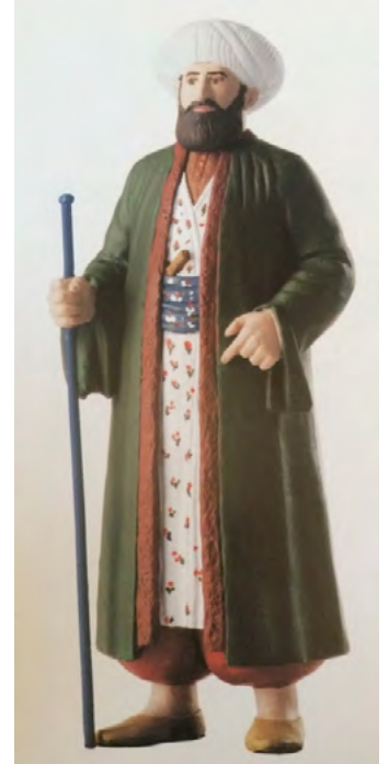
App. 6: PATRONA (Atabey, 2005, p. 19)

Also figures were made by gold or silver according to seniority of officers. This rank insignia system would be left in Abdulmecid era, we view on the Ottoman rank insignias' reregulation and Britishing with Crimean war (Atabey, 2005, p. 50). In British system, rank insignias on sleeve hem. Today Turkish Naval Forces have still continuing this system (Rutbe Isaretleri, 2016)