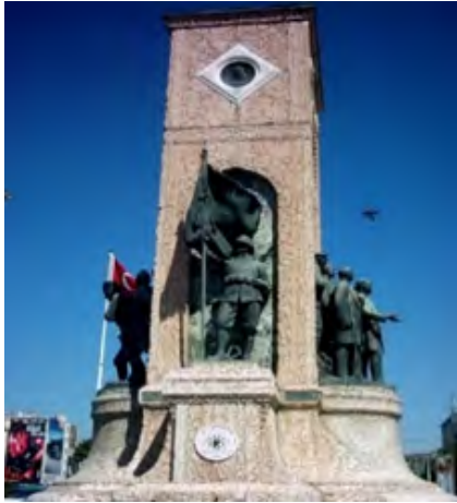
Figür 4. Batı cephesinde bulunan asker heykeli.)

Anıtın yan yüzlerinde kahramanlığın sembolü olan sancak taşıyan birer asker heykeli, üstlerindeki madalyonlarda ise birer kadın portresi yer almaktadır. Doğu cephesindeki kadın portresi peçeli ve mutsuz, batı cephesinde bulunan kadın portresi peçesiz ve gökyüzüne bakan mutlu bir yüz ifadesine sahiptir.