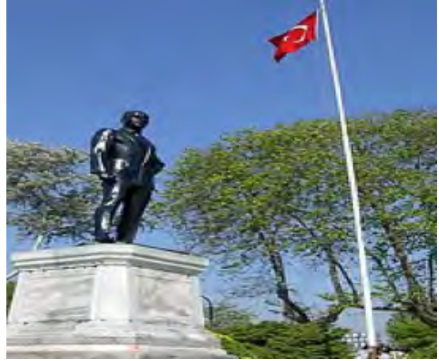
(Sarayburnu'nda Mimar Heinrich Krippel 25 Ağustos 1925'te başlanıp 1926 yılında bitirilen ilk Atatürk heykeli)