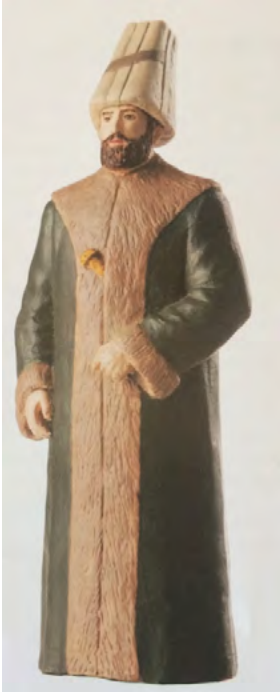
App. 3: KAPUDAN PASHA (Mahmud Sevket, 1983, p. 37)