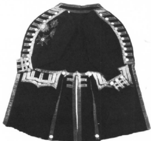
App. 21: FULL DRESS COAT OF VICE-ADMIRAL NELSON (Wilkinson-Latham and Embleton, 1977, p. 25)

Naval cadets wore purplish grey broadcloth a pants and jacket with closed-neckband (see app. 15). The jacket had