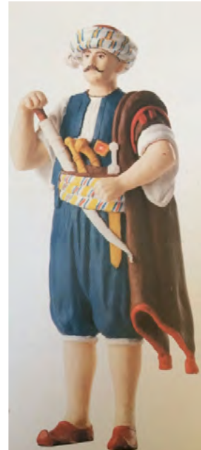
App. 10: GALLEONER (Atabey, 2005, p. 35)