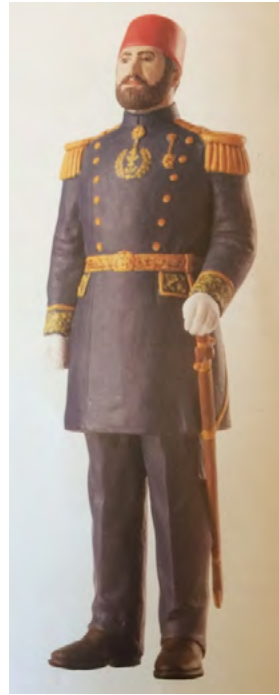
App. 13: PATRONA AFTER DRESS REFORM (Atabey, 2005, p. 44)