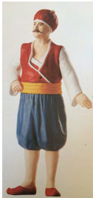
App. 9: LEVEND (Atabey, 2005, p. 29)