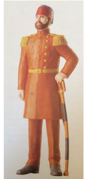
App. 14: NAVY OFFICER AFTER DRESS REFORM (Atabey, 2005, p. 45)

It was prepared red and blue uniforms like European soldiers for Nizam-i Djedid soldier (Atabey, 2005, p. 37) (see app. 1).