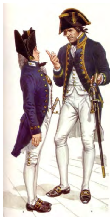
Midshipman (on left) and Commander (on right)