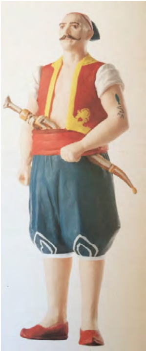
App. 11: CIPLAK ERI (Atabey, 2005 p. 40)