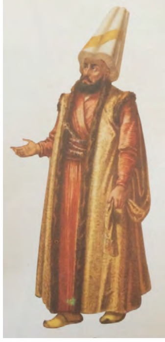
App. 4: KAPUDAN PASHA IN THE ALBUM OF JEAN BRINDESI (Atabey, 2005, p. 13)