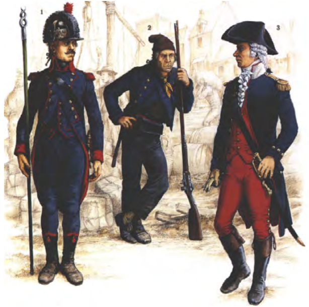
Marine (on left), Sailor and Navy officer (on right)

French Navy after comparing European naval uniforms. French uniforms involved button rows and dark blue was used mostly both in pants and in setre like Ottoman uniforms. Red was also used in marines. Some belts of French uniforms, which were golden, had navy stuff depictions. Epaulettes were brocaded and had thick fringes. Sleeve hems and pocket flaps of setre were also brocaded. In addition ensigns on neck was same (Chartrand and Back, n.d, 25-32 and Atabey, 2005, p. 41-49). Despite all it is said difficult that French and Ottoman uniforms were similar in my opinion. Although French setre was buttoned up on only its top, Ottoman uniform was closed from top to down and was belted. Ottoman uniform was plainer than French's. Both two navies used neckband in setre. In contrast to Ottoman neckband was small and closed, French's was coarse and was not closed. The French used necktie not Ottomans (see app. 24).