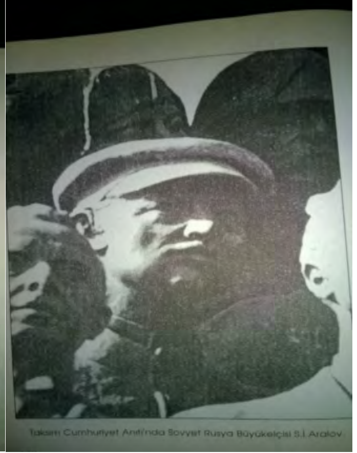
Taksim Cumhuriyet Anıtında Sovyet Rusya Büyükelçisi S.İ. Aralov.