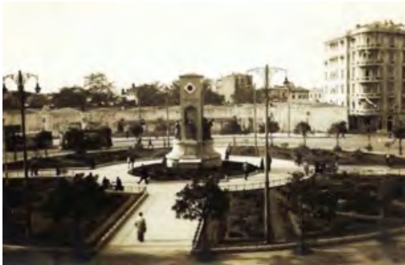
1929 YILINDA TAKSİM MEYDANI