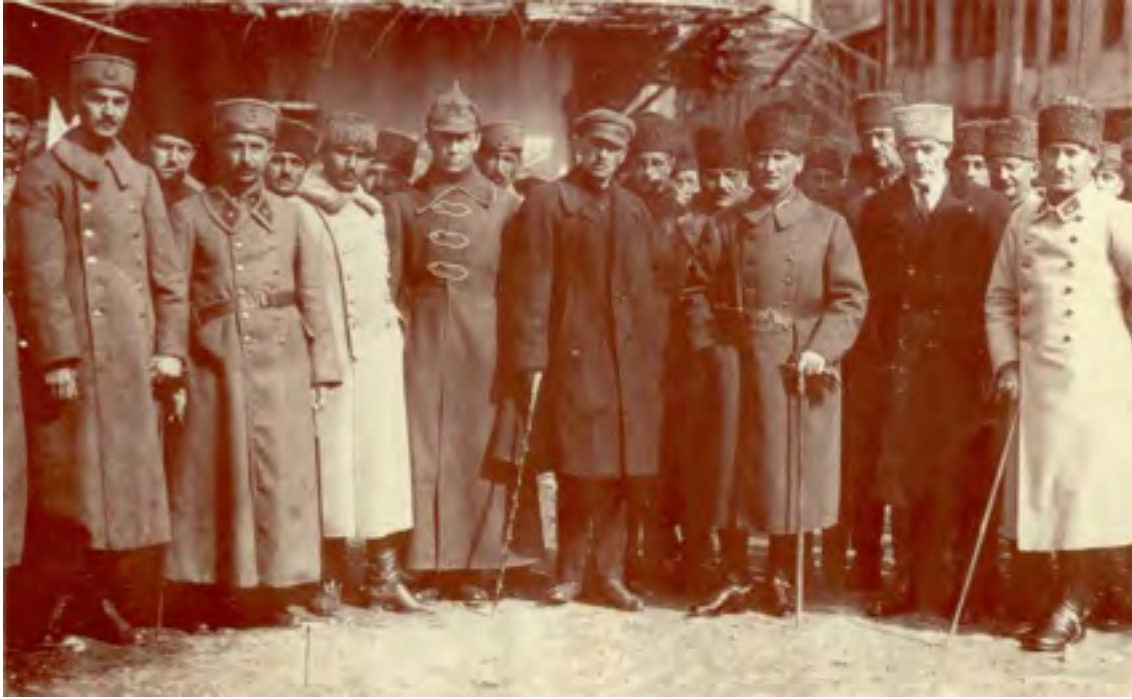
Fotoğraf. (Büyük Taarruz'dan önce Konya civarında yapılan teftiş gezisi sırasında Mustafa Kemal, İsmet İnönü, Rusya büyükelçisi S.Aralov, askeri ataşe K.Zvonarev ve Azerbaycan Büyükelçisi. Abilov, 23 Mart 1922 ).

Taksim'de yaptırılan Cumhuriyet Anıtı, Atatürk döneminde meydana getirilen anıtların içinde en önemlisidir. Taksim Cumhuriyet Anıtı ve Taksim Meydanı sadece Cumhuriyet dönemi İstanbul'unun değil, yeni Türkiye'nin sembolü haline gelmiştir. Anıtın yapımına 1925 yılında başlanmış ve 1928 yılında anıtın yapımı tamamlanmıştır. İtalyan heykeltıraş Pietro Canonica'ya yaptırılan anıt, iki genç Türk; Hadi (Bara) Bey ve Sabiha (Bengütaş) Hanım'ın yardımlarıyla tamamlanmıştır. 8 Ağustos 1928'de de 30 bin İstanbullu'nun katılımıyla TBMM Başkanı Kazım Özalp tarafından açılmıştır.