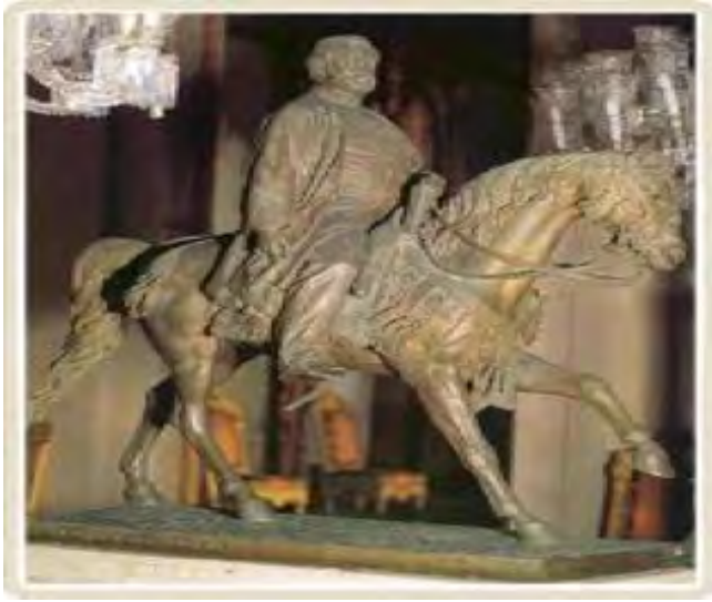
(Sultan Abdülaziz'in Beyberbeyi Müzesi'ndeki Heykeli) 37