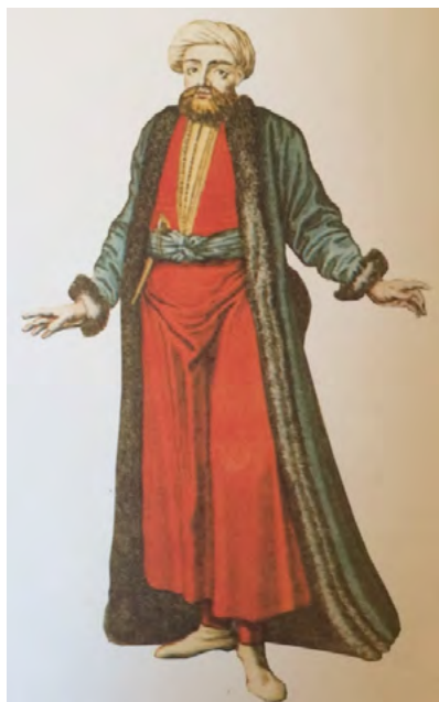
App. 8: REIS (Mour, 1980, p. 37)