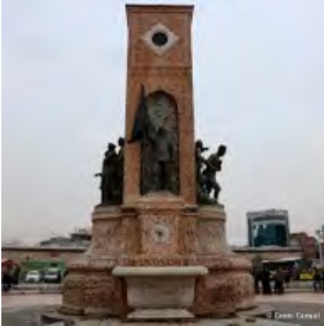
Figür 6. (Doğu cephesindeki asker heykeli.)