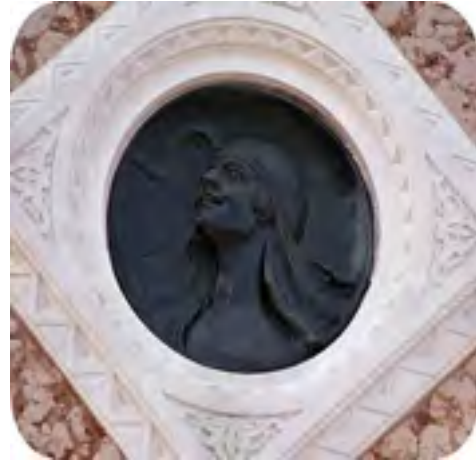
Figür 5. Batı cephesinde bulunan asker heykeli üzerindeki kadın portresi peçesiz ve gökyüzüne bakan mutlu bir yüz ifadesine sahiptir.)