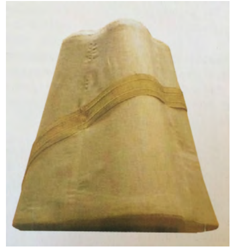
App. 2: KALLAVI (Atabey, 2005, p. 11)

Ottoman Navy uniforms had rank insignias firstly in Mahmud II era. This rank insignia system be predicated on figure and color distinction of necklace officers wear. Figures were anchor, propeller or octant according to military class.