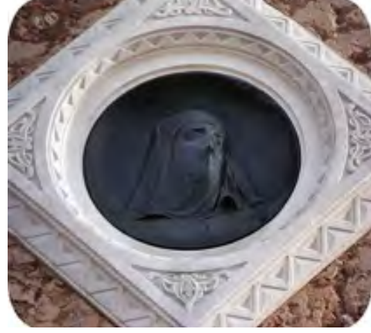
Figür 7. (Doğu cephesindeki asker heykeli üzerindeki kadın portresi peçeli ve mutsuzdur.) 47