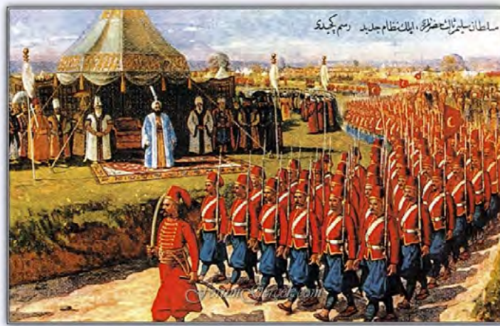
App. 1: A MARCH OF NIZAM-I DJEDID (Kucukerman, 1997 p. 40)

Keywords: Uniform, Navy, Ottoman, Westernization, Mahmud II, Fez, Setre, Pants.