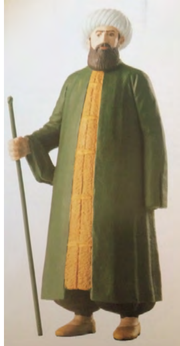
App. 5: KAPUDANE (Atabey, 2005, p. 18)