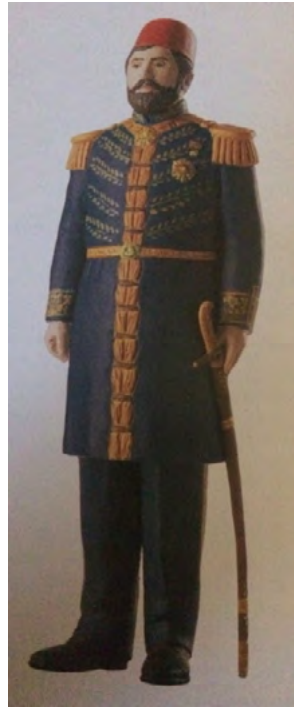
App. 12: KAPUDAN PASHA AFTER DRESS REFORM (Atabey, 2005, p. 42)