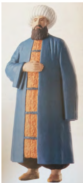
App. 7: RIYALE (Atabey, 2005, p. 20)

soldiers and 27 officers in 1797, there were, in 1806, 22,685 soldiers and 1590 officers (Mantran, 2001, p. 14). In the same way sultan who were interest in military education established an engineer school in 1795.