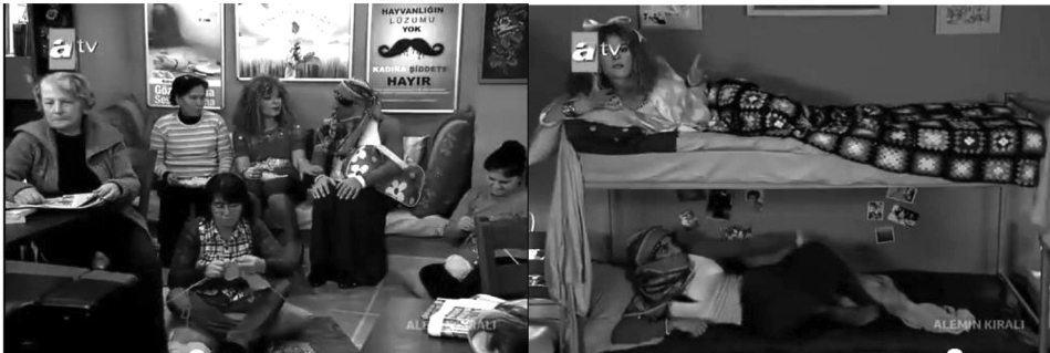
Resim 2: Nihale ve kadın kılığındaki Kubat karakterinin kadın sığınma evindeki görüntüsü

Dizinin her bölümünde, Aslan Bey'in kayınvalidesi Asalet Hanım'la arasındaki ölçsüz çekişmeleri, Nihale'nin eşi Kubat tarafından psikolojik ve fiziksel şiddete maruz kalışı ve Nihale'nin öğrenilmiş çaresizliği komik bir biçimde ve argo bir dil kullanılarak anlatılmaya çalışılmaktadır.