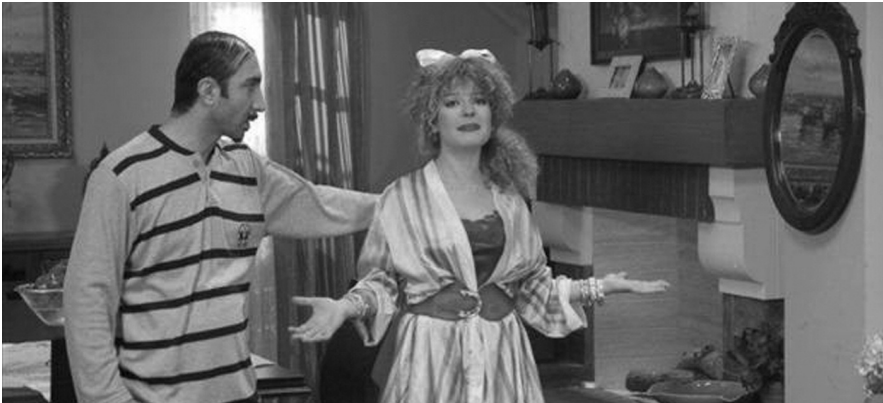
Resim 7: Çocukların sosyal medyada paylaştıkları video görüntüsü

Berkowitz'e göre, şiddet gösterimini izlemek arınma yaratmak şöyle dursun, saldırganlık eğilimini arttırmakta; bu ise, yaşamda şiddete yöneltebilmektedir. Bandura ve diğerlerine göre, şiddet gösterimini izlemek kişiye şiddet örneklerini öğretip kazandırmakta; çevremizdeki diğer modellerde olduğu gibi, kitle iletişimi araçlarındaki şiddet gösteriminden öğrendiğimiz bu modellerden de ilerisi için davranışa hazırlık biçimleri edinmemize yol açmaktadır. Böylece; ileride, benzer bir durumla karşılaştığımız herhangi bir anda o zamana kadar unutulmuş gibi duran bu davranışsal hazırlıklarımız, küçük bir belirtken uyarı ile karşılaşır karşılaşmaz aktifleştirmekte; şiddet davranışlarında bulunmamıza yol açmaktadır. (Bandura, 1977: 30) Şiddet gösterimini izlemek Bandura'ya göre, kişiye şiddet enformasyonlarını öğretmektedir. Birey, öğrendiği anda değil, benzer olaylarla karşı karşıya kaldığı gerekli olduğu anlarda kullanmaktadır.