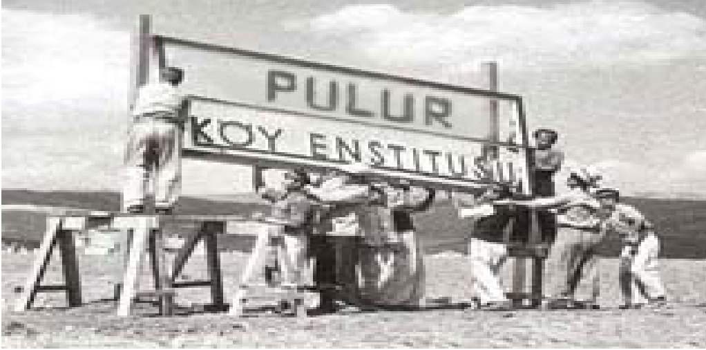
Foto1: Pulur Köy Enstitüsü'nün tabelası hazırlanırken