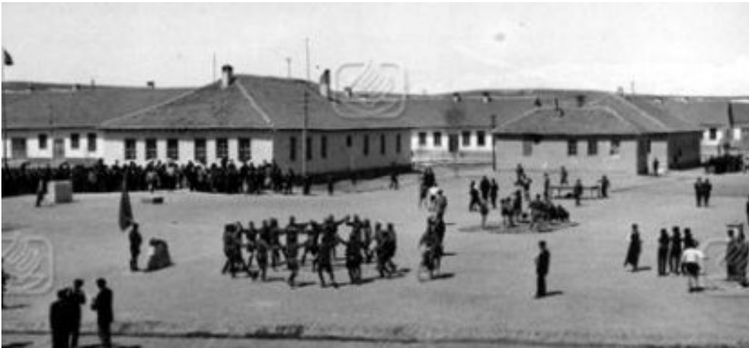
Foto 2: Pulur Köy Enstitüsü'nün kampüsü