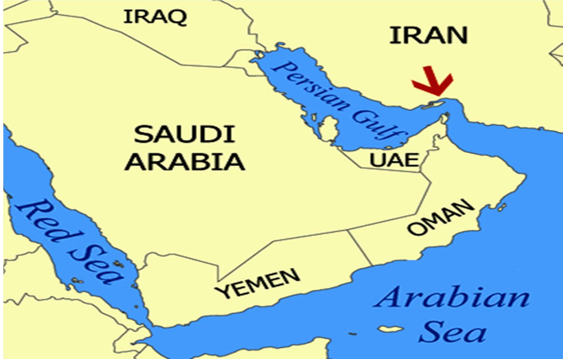
Harita 1. Basra Körfezi 2

Basra Körfezi -Pers Körfezi olarak da geçmektedir. 600 millik bir deniz alanına sahip olup yüzölçümü 240.000 km 2 'yi bulmaktadır. Bir iç deniz olarak da görülen bu körfez Irak kıyılarında Şattülarap'ın ağzından başlayarak Hürmüz Boğazı çıkışına kadar olan uzunluğu 975 km, en geniş yerinde eni 370 kilometre olan bölgeyi ifade etmektedir. Genel olarak körfezin derinliği İran'a yakın taraflarda 90-110m arasında iken Arap kıyılarında ortalama 35 m. civarındadır. Basra Körfezi'nin kıyıları, İran'ın güneybatı sınırlarından Bender Abbas'a, Kuveyt'e, Suudi Arabistan'ın Kuveyt sınırlarından Khobar'a, Bahreyn'e, Katar'a, Birleşik Arap Emirlikleri'ne, Umman'a ve Maskat'a kadar uzanmaktadır. 1