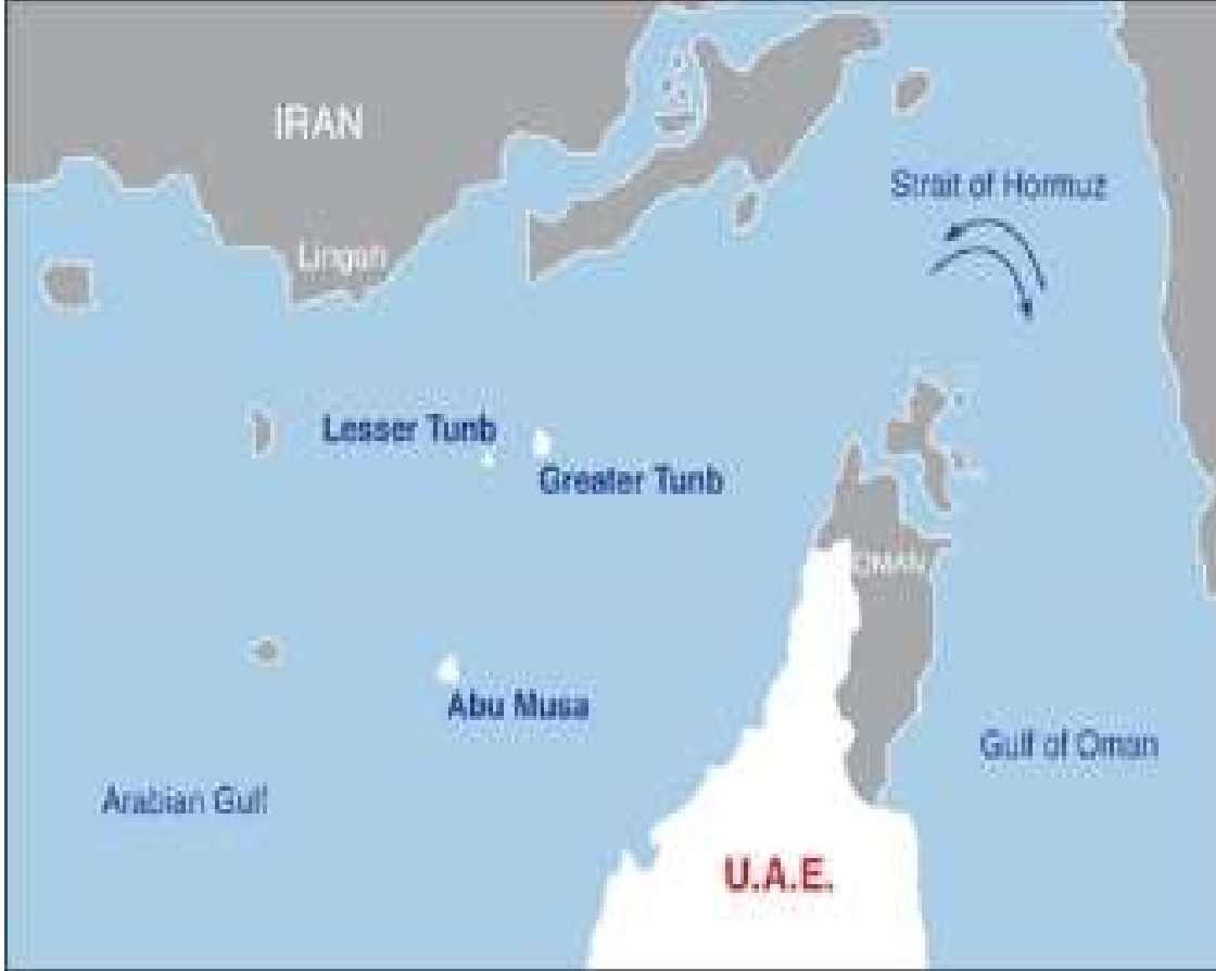
Harita 2. İran'ın ilhak ettiği adalar

İngiltere 1908 yılından beri Basra Körfezi'ndeki diğer adalarla birlikte Ebu Musa adasını da idare etmiştir. 60'lı yılların sonuna gelindiğinde ise adanın idaresini Şarcah Emirliğine devretmiştir. Fakat bu durum uzun sürmemiş, 1968 yılında İngiltere Basra Körfezi'ndeki hâkimiyetine son vereceğini ilan ettikten sonra, İran adayı yeniden işgal etmek istemiştir. 11