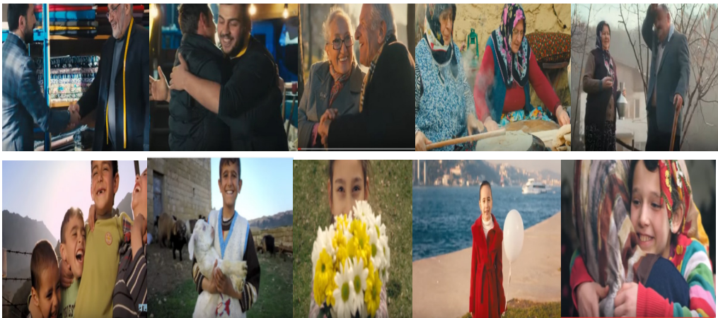
Şekil 4. Reklam Filminde Yer Alan Manevi Unsurlar