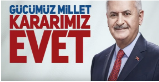
Şekil 1. Seçim Afişi

Semboller, iletişim ve reklam sürecinde duygularla ifade edilemeyen şeylerin somut nesnelere ifade edilmesidir. Toplumsal birlikteliğe, bayrak, cami, at, gibi sembollere vurgu yapılmaktadır.