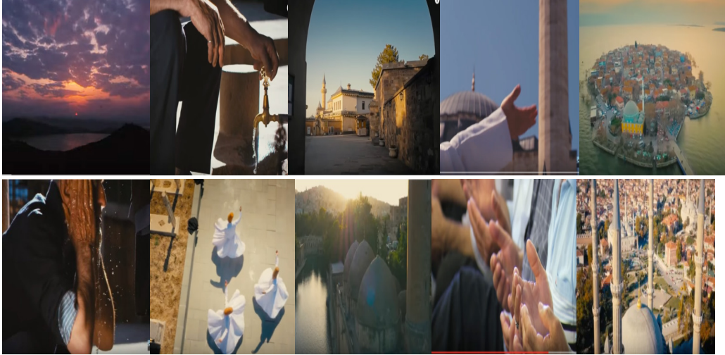
Şekil 2. Reklam Filminde Yer Alan İnanç Unsurları

Gösterge: Ak Parti Referandum reklam filmi görselleri (2017)