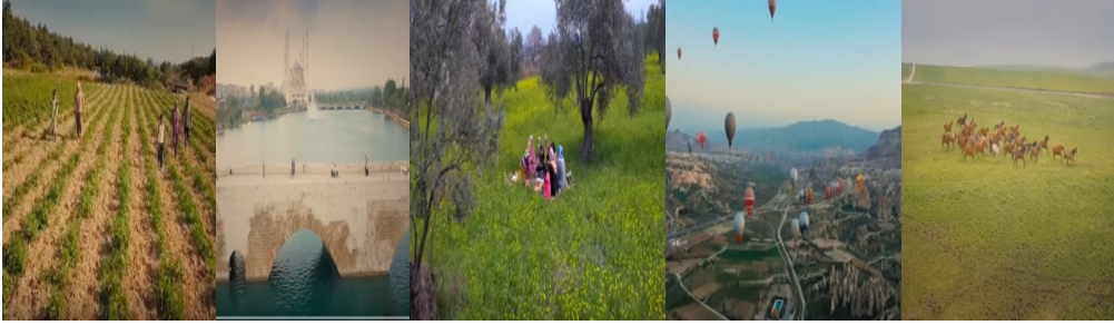
Şekil 5. Reklam Filminde Yer Alan Coğrafi Unsurlar

Gösterge: Ak Parti Referandum reklam filmi görselleri (2017)