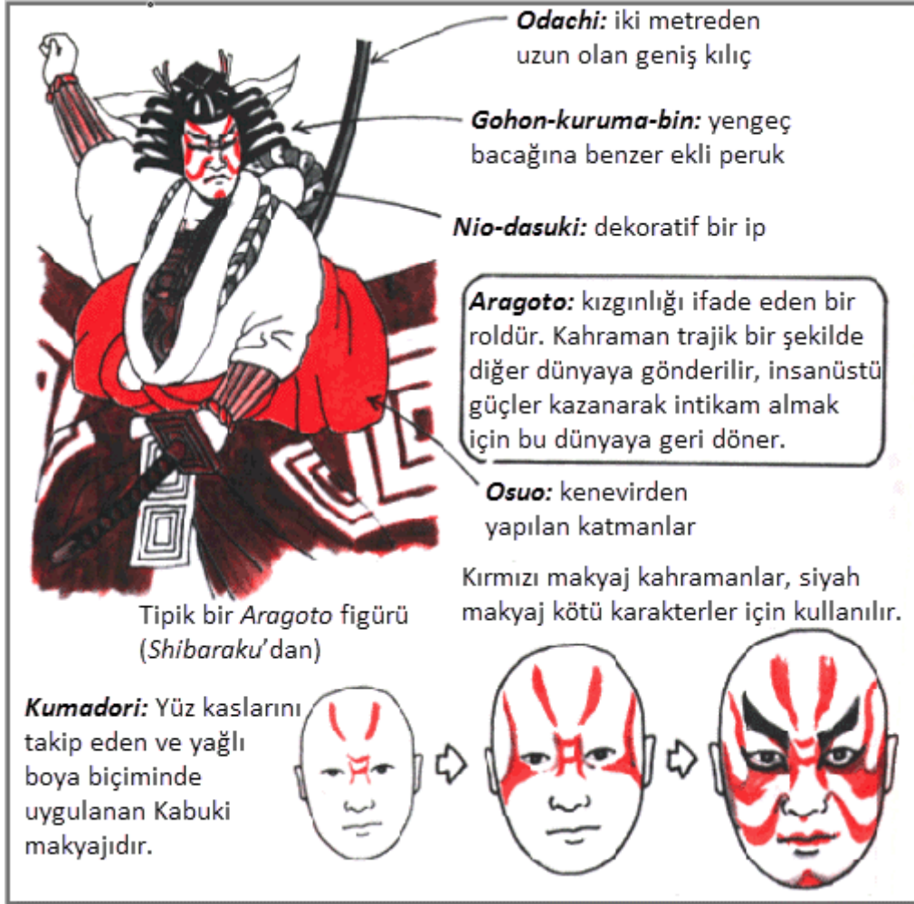
Resim 5: Kabuki Makyajı ve Aragoto Kostümü Örneği 22

Kabuki tiyatrosu işte bu altın çağın bir ürünüdür 21 . Kabuki oyunlarıyla bu burjuva yaşam biçimi daha geniş halk kitlelerine ulaşır hale gelmiş ve günlük yaşamın ve kültürün stilize edilerek temsil edildiği sahne kültürü ülkede saygın bir yer edinmiştir.