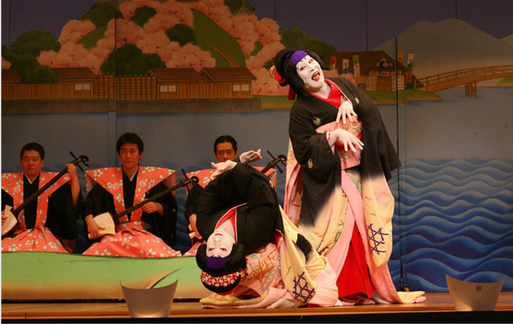
Resim 8: Kabuki Tiyatro Dansından Örnek 28

asiller, bushi; samuray-savaşçı sınıf, hyakushou; çiftçi ve chonin; taşralı olarak ayrılmaktaydı. Oyunlarda kahraman, kötü adam, yaşlı kadın, genç kadın, genç adam, yaşlı adam, komedyen ve çocuk tipleri sabitti. Diğer karakterler, şeytanlar, cadılar, ruhlar ve hayvanlardı 25 . Kabuki tiyatrosundaki orkestra kar, yağmur, fırtına, rüzgâr dalgalar ve hayalet sesler için sembolik ses efektleri yaratırdı. Oyuncular sadece sahneye bağlı değillerdi, elastiki bir hareket vardı. En önemli beden sunumu unsuru ise danstı. Bu danslar edebi imgelere uygunluk gösteren, ekonomik ve ritmik hareketlerle akmaktaydı. Oyuncular danslarıyla bazen anlatıyı canlandır bazen de diğer kelimeleri canlandırır. Fiziksel pozlar ve soyut imgeler bulunmaktaydı 26 . Kadın rolünü canlandıran erkekler için makyaj önemli bir unsur haline gelmişti. Makyaj oyunculuğu güçlendiren, dramı ve güldürüyü derinleştiren bir durum olmuştu. “Tüm dikkatimizi bedene ve onun güçlendirilmesine vermemizi onaylayan öteki etken, arzu boyutudur. Geldiğimiz kültür; içgüdüler, dürtüler ya da kökleşmiş ihtiyaçlarla ilgisi olan her şeye karşı şüpheliydi. Ruh sahibi olma günahın dini versiyonunda ya da burjuva ahlakının laik-püriten versiyonunda; ilke bedeninin dürtülerinin kaynak ve etkisinin temelde kötü olduğunda ve bu nedenle yeterince sınırlandırılmazlarsa yaşamın düzgün yönlendirilmesine zarar vereceklerinde ısrar eder...” 27