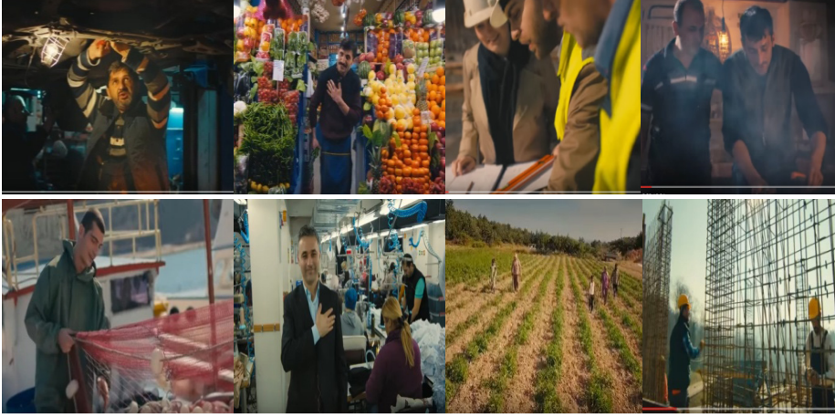
Şekil 6. Reklam Filminde Yer Alan Ekonomik Unsurlar

Gösterge: Ak Parti Referandum reklam filmi görselleri (2017)