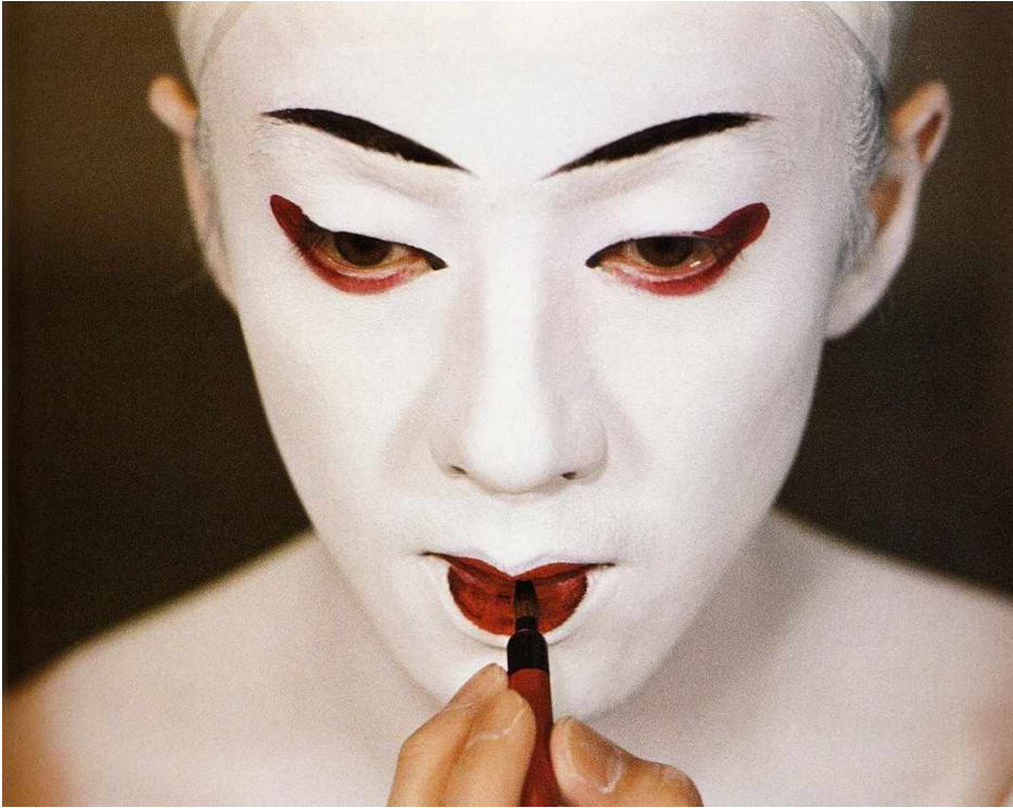
Resim 3: Onnagata Makyajı 18