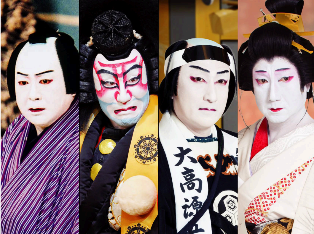
Resim 7: Tiyatrosunun Karakterleri 24

zaman ve mekâna ilişkin olayları ve karakterler, detaylı bir biçimde anlatırlar. Çobo yönetmen gibidir, oyunu yönlendirir ve yönetir. Görüldüğü üzere Kabuki oyunlarında oyuncu sayısı değişse bile karakter sayısı üçle sınırlı kalmaktadır. İyi-kötü çatışması süreklilik halindedir. Bu noktada kayda değer olan durum, hâkim otoritenin ve buna uygun olarak biçimlenen ahlaki değer yargılarının kadın oyuncularını sahneden uzaklaştırılmasıyla, tiyatro sahnelerini tamamen erkek egemen bir alan haline gelmesidir. Bu şekilde günlük hayatın temsiline bir yarım kalmışlığı söz konusudur. Kadın, Tokugawa toplumsal prensipleri doğrultusunda kamusal alanda geri planda tutulurken, hatta yokluğa doğru itilirken, temsilen bile varlığı ortadan kaldırılmıştır. Kabuki sahnesi, erkeklerin erkeklerle oynadığı bir oyun alanı olarak kadınlık rolünü bile erkeklere layık görmüştür. Kadının toplumsal kimliğinin ihlali, kadın rolünü oynayan erkekler üzerinden telafi edilmeye çalışılmıştır. Kadın temsilleri için uzun yıllar eğitim görmesi gereken erkek oyuncular ise bir süre sonra kaçınılmaz olarak feminen veya travestimsi bir kimlik kazanmıştır. Bu noktada Kabuki tiyatrosu tamamen bir erkek tiyatrosu haline dönüşmüştür. Kadın rolünü oynamaya çalışan erkek oyuncu inandırıcı olabilmek adına bir kadından daha fazla feminen hale gelmiş, hem komik duruma düşerek izleyiciyi güldürmeye çalışmış hem de kadın kimliğine yönelik algıya olumsuz etkilerde bulunmuştur.