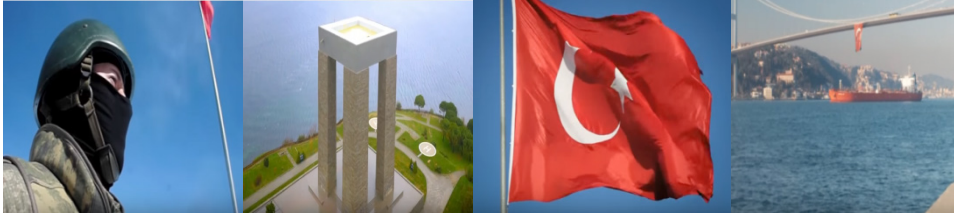
Şekil 3. Reklam Filminde Yer Alan Ulusal Unsurlar

Gösterge: Ak Parti Referandum reklam filmi görselleri (2017)