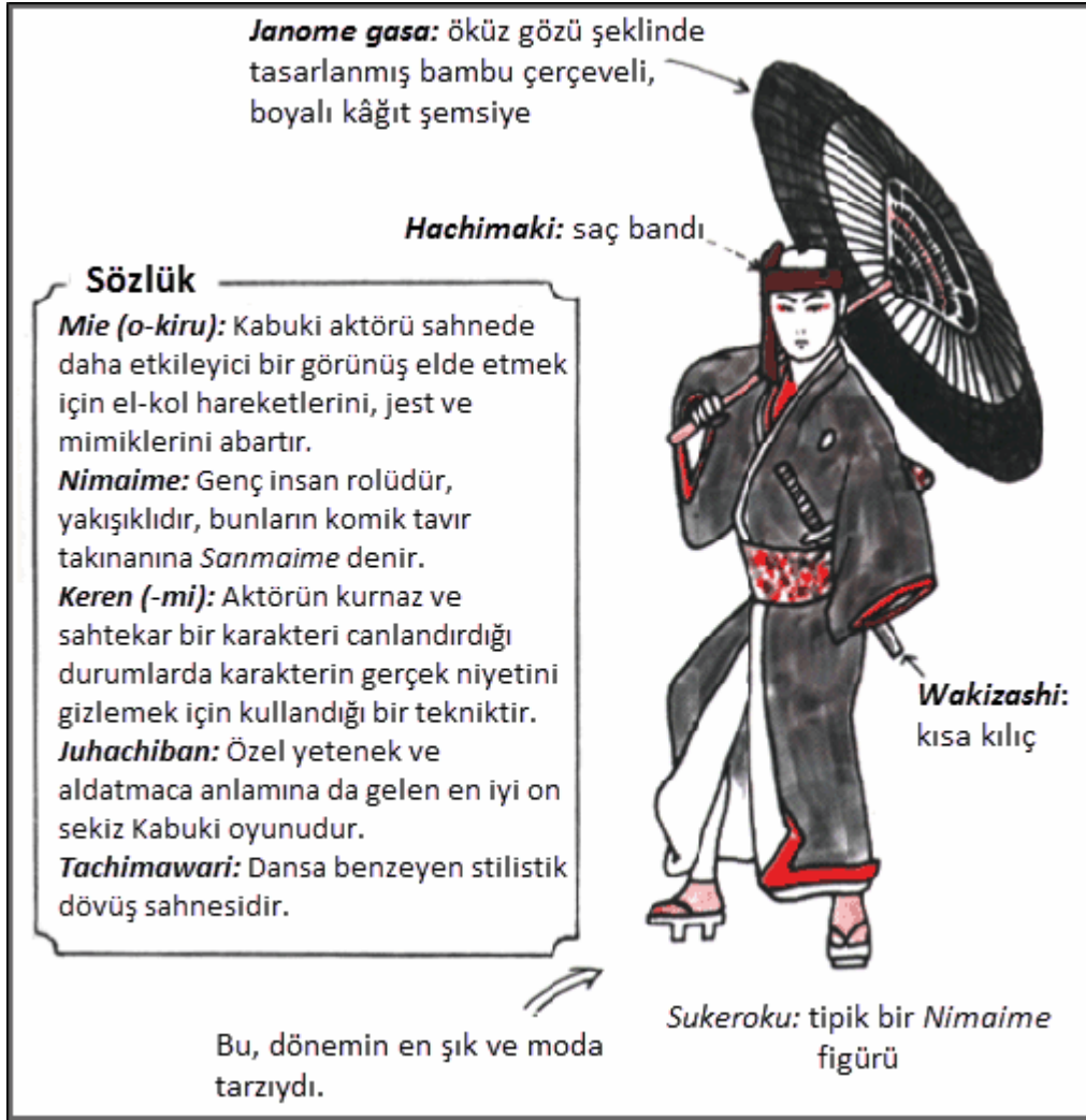
Resim 4: Kabuki Sahnesinin Kostümleri, Beden Dili ve Özel Terimlerinden Bir Örnek 20

Katı görgü kuralları Tokugawa dönemi kültürünü sıkı bir şekilde kaplamıştı. Adolphe Clarence Scott'a göre bu dönemde yemek yemenin, içmenin, giyinmenin, zamana ve mekâna göre hareket etmenin doğru yolları vardı. Bu durum, tatamide oturma, uyuma yemek yeme gibi yaşam biçimlerini karakterize etmekte, bireysel stilde belirli bir jestler bütünü ve hareketler yaratmaktaydı. Yaşam halleri Kabuki sahnesindeki performanslarda da temsil edilerek, sahne teknikleri ve özel efektlerle güçlendirilip yeniden yaratılmaktaydı. Konfüçyüsçü ilkelerin Japon sosyal sınıflarındaki hâkimiyetinden sonra Kabuki tiyatrosu, konformist olmayan çizgiden, kültürün ve sosyal beklentilerin yansıtıldığı bir noktaya doğru evrim geçirmiştir 19 . Tokugawa dönemi içinde yer alan Genroku döneminde (1688-1704) üç büyük kentin halk tabakasından