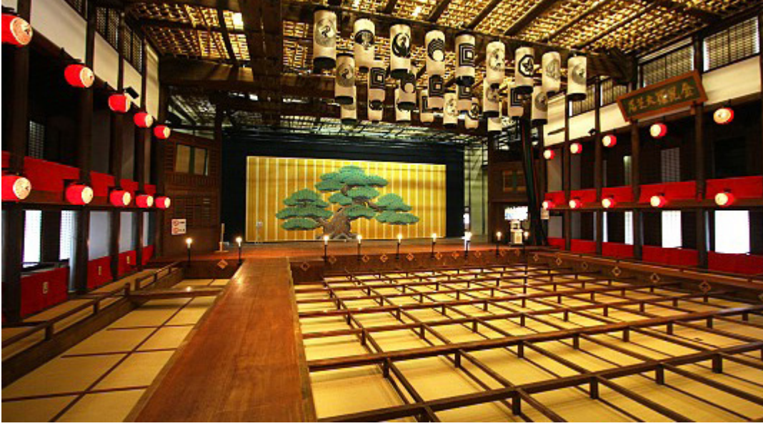
Resim 1: Hanamichi Sahnesi 16