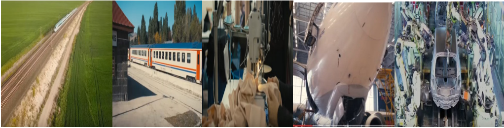
Şekil 7. Reklam Filminde Yer Alan Teknolojik Unsurlar

Gösterge: Ak Parti Referandum reklam filmi görselleri (2017)