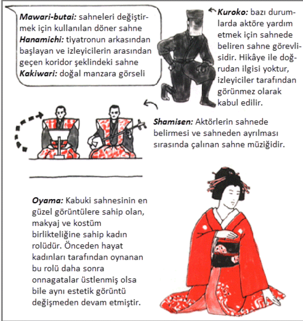
Resim 6: Kabuki Sahnesinden ve Rollerden Bir Kesit 23