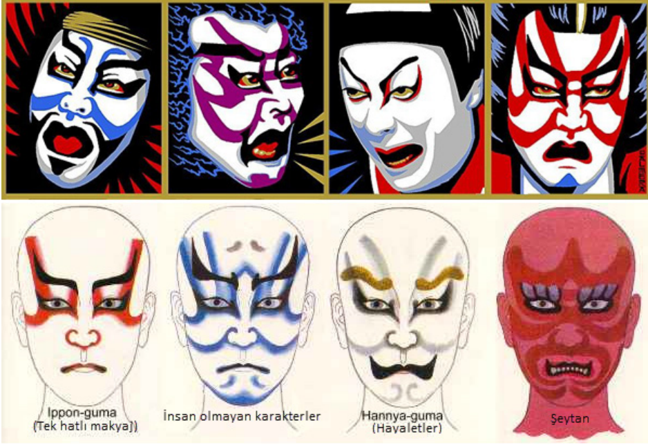
Resim 2: Kabuki Tiyatrosunun Makyaj Stillerinden Örnekler 17