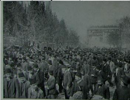
Resim 13. Hareket Ordusu şehitlerinin cenaze alayı resimlerinden [ Resimli Kitap , 21 Mayıs 1909 (8 Mayıs 1325), no. 8, s. 757.]