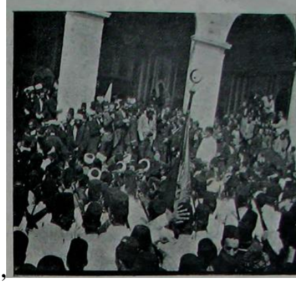
Resim 7. Babıali önünde temayüşler [ Resimli Kitap , Eylül/Ekim 1908 (Eylül 1324), no. 1, cilt: 1, s. 80.]