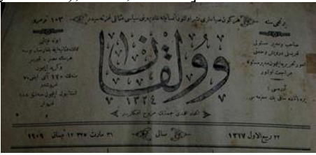
Resim 15. 31 Mart 1325, 13 Nisan 1909 tarihinde çıkan Volkan Gazetesi Manşeti