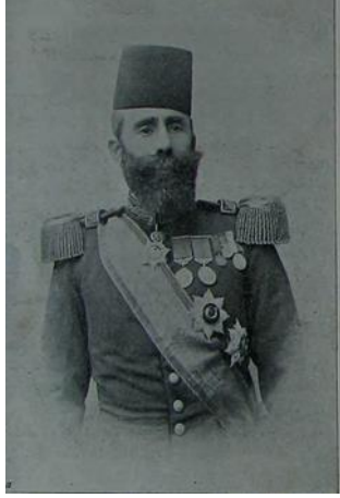
Resim 9. Hareket ordusu kumandanı Mahmud Şevket Paşa [ Resimli Kitap ]