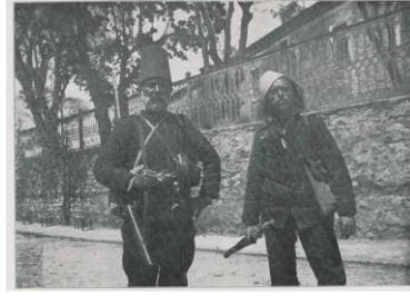
Resim 8. Meşrutiyetin korunması ve hürriyet için Hareket Ordusuna katılan iki gönüllü [ Şehbal 28 Mayıs 1909 (15 Mayıs 1325), s. 90.]