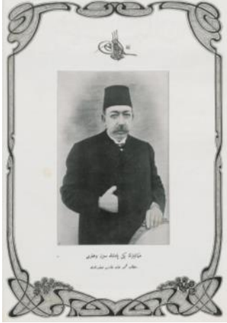
Resim 1. Yeni Padişah Mehmed Reşat [ Şehbal 28 Nisan 1909 (15 Nisan 325), s. 64.]