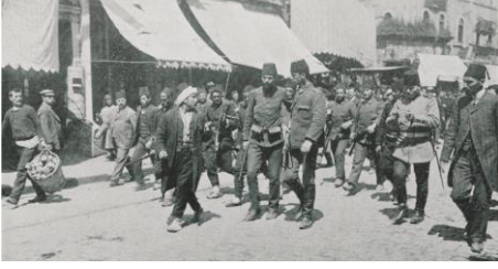
Resim 7. Sahte sarık ile ele geçirilen bir mürteci [ Şehbal 28 Mayıs 1909 (15 Mayıs 1325), s. 94.]