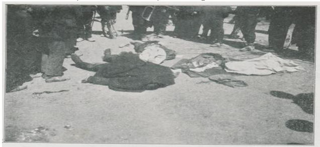
Resim 6. Taksim musâdemesinde maktûl olanlardan birkaçı. [ Şehbal 28 Mayıs 1909 (15 Mayıs 1325), s. 91.]