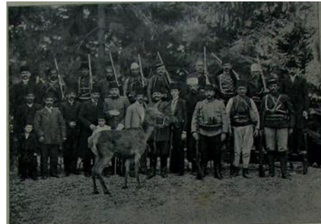
Resim 14. Niyazi Bey ve Geyiği [ Resimli Kitap , 21 Mayıs 1909 (8 Mayıs 1325), no. 8, s. 779.]