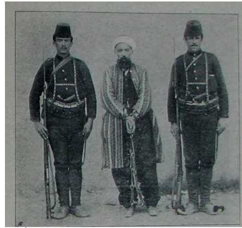
Resim 9. İrticacılardan olup Hoca kıyafetinde yakalanan bir şahıs [ Resimli Kitap , 21 Mayıs 1909 (8 Mayıs 1325), no. 8, s. 794.]