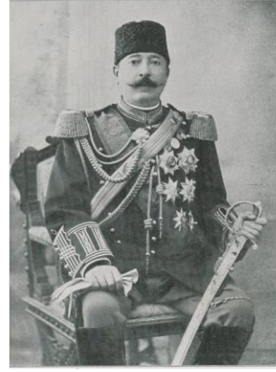
Resim 2. 31 Mart Vak'asında yaralanan Bahriye Nazırı Rıza Paşa [ Şehbal 28 Nisan 1909 (15 Nisan 325), s. 67.]