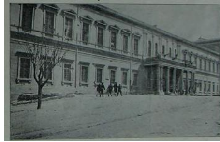
Resim 12. Teslimden sonra Taşkılla'nın cepheden görünüşü [ Resimli Kitap , 21 Mayıs 1909 (8 Mayıs 1325), no. 8, s. 758.]