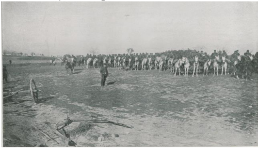
Resim 5. Ayastefanos'ta Hareket Ordusu [ Şehbal 28 Nisan 1909 (15 Nisan 325), s. 70.]