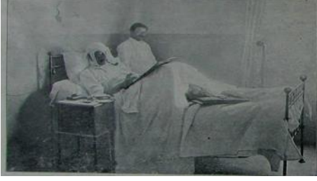
Resim 14. 31 Mart Vak'asında yaralanmış olan Amerikalı İngiliz gazete muhabiri hastanede [ Resimli Kitap , 21 Mayıs 1909 (8 Mayıs 1325), no. 8, s. 783.]