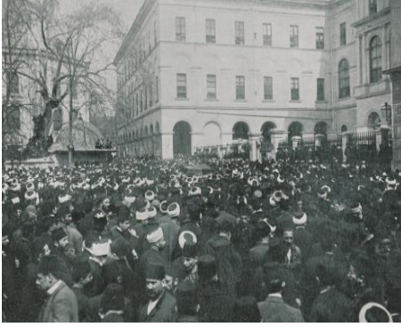
Resim 3. Serbesti gazetesinin başyazarı olan ve cinayete kurban giden Hasan Fehmi'nin cenaze alayı [ Şehbal 28 Nisan 1909 (15 Nisan 325), s. 67.]