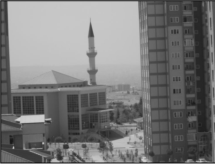
Resim 1: TOKİ Camii 1

Gecekondualarını bırakıp, Karacaören-TOKİ sitesindeki dairelerine yerleşen ailelerin yaşamında ani ve radikal bir deđişiklik olması kaçınılmazdır. Site gecekondu mahallelerinden çok farklı bir çevredir: 12 katlı 34 blok, 15 katlı 4 blok ve 4 katlı 38 binadan oluşmaktadır. TOKİ site içine iş merkezi, ilköğretim okulu, lise, sađlık merkezi ve cami inşa etmiştir. Zamanla bu binalar işlevlerine kavuşmuşlardır. İlk zamanlar şehirle bağlantıda büyük zorluk yaşanmış, seyrek gelen otobüslerle ulaşım sağlanmaya çalışılmıştır. Pursaklar'daki Yunus Market'in bedava servisleri bu dönem çok işe yaramış, insanlar dolmuş gibi bu servisleri kullanmaya başlamışlardır. Ancak durumun farkına varan Yunus Market yöneticileri servise binenlerden Market'den alınan alışveriş fişlerini göstermelerini zorunlu kılmış, yine de servis popülerliğini kaybetmemiştir.