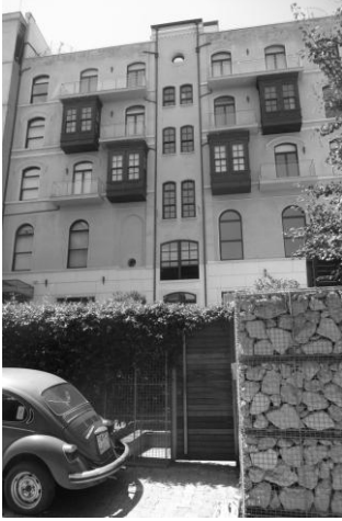
Resim 6-7: Ali Hoca Aralığı'nda yer alan "NOA-Ali Hoca 6 Apartmanı" ve yenilenmiş bir apartman bloğundan görünüşler.

Galata'da yapı ölçeğinde yaşanan 'yersizleşme', tek merkezden üretilen, katılımcı olmayan, fiziksel ve sosyal açıdan olumsuz sonuçlar doğuracak 'yenileme projeleri' ile artma riski taşımaktadır. 05.07.2005 tarihinde yürürlüğe giren 5366 sayılı 'Yıpranan Tarihi ve Kültürel Taşınmaz Varlıkların Yenilenerek Korunması ve Yaşatılarak Kullanılması Hakkında Kanun' çerçevesinde, Beyoğlu'nda 'Yenileme alanı' ilan edilen Tarlabası semti, Cezayir Çıkması (Fransız Sokağı), Tophane Bölgesi, Belediye Binası ve çevresi ile Bedrettin Mahallesi'ndeki bazı bölgeler ve Galata Kulesi çevresi için geliştirilen tartışmalı projeler bulunmaktadır. TOKİ ve yerel yönetimler işbirliğinde uygulanacak olan bu kentsel yenileme projeleri temelde mevcut