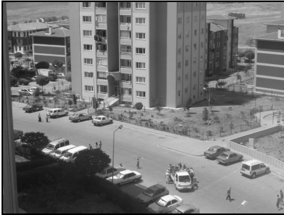
Resim 12: Karacaören TOKİ sitesi genel görünüm

Sitenin zamanla Batı'daki gibi suçun yuvalandığı gettolar haline dönüşüp dönüşmeyeceği sorusuna ise şu anda net bir cevap verilememektedir, ancak bu risk olasılık dışı da bırakılamamaktadır. Sitedeki gecekondu dönüşümünden gelen kimi ailelerin daire ve binalarını sahiplenme durumları, bu tehlikeyi engelleyici bir faktör olarak ortaya çıkarmaktadır, ancak bu ailelerin ne derece başarılı olabilecekleri soru işaretidir. Hızla elden çıkartılan ya da kiraya verilen daireler ve dolayısıyla sürekli değişen site sakinleri sitenin sahiplenilmesinde bir engel teşkil etmektedir.