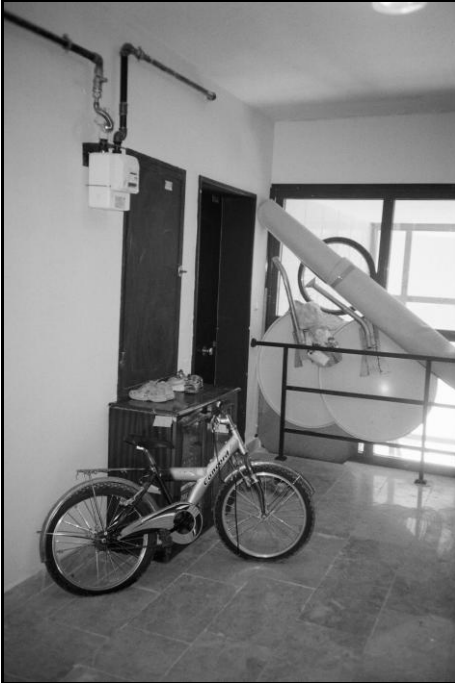
Resim 7: Bina holü

Tüm bloklarda uygulanan bir kural balkonlardan aşağı halı silkmenin yasak olmasıdır. Haftanın bir günü buna ayrılarak, halılar yangın merdiven sahanlığından silkelenmektedir. Yine de, eskiye oranla azalmasına karşın, yer sofrasında yenen yemekten sonra pencerelerden sofranın silkelenmesi, sigara izmaritlerinin atılması olasıdır.