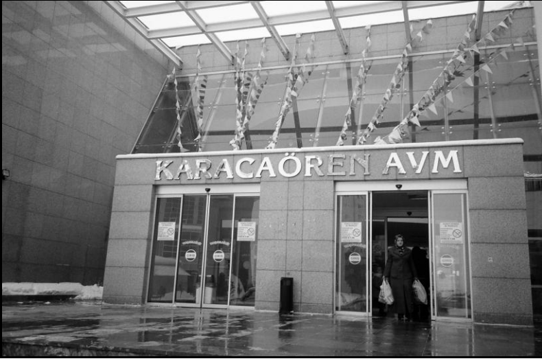
Resim 10: Karacaören AVM

Karacaören AVM'sindeki marketleri dolaşarak, hangisinde en ucuzunu bulurlarsa oradan alışveriş etmektedirler. Karacaören'de Pazartesileri pazar kurulmakta, taze sebze ve meyvenin yanında birkaç kıyafet ve mutfak eşyası da satılmaktadır. Site halkı Pursaklar pazarına göre kendi pazarlarını pahalı bulmaktadır.