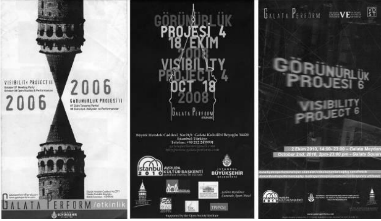
Resim 4-5: Galata ve çevresindeki sanat etkinliklerini tanıtan broşür örnekleri ve Görünürlük Projesi'nin tanıtıldığı broşür kapakları.