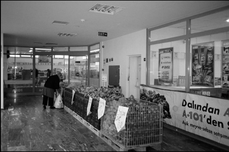
Resim 11: Karacaören AVM iç görünüm