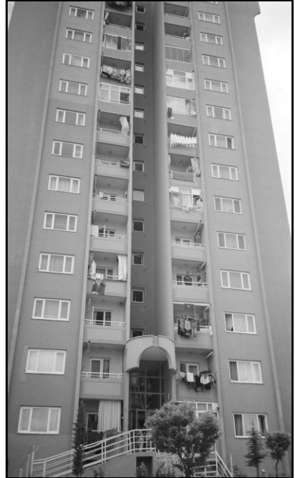
Resim 8: Sitedeki bir bloğun genel görünümü