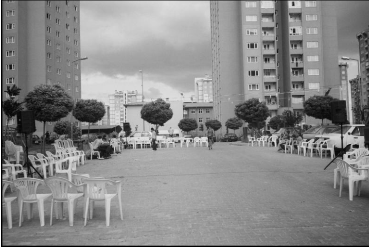
Resim 6: Açık hava düğünü

rekli gürültü haline dönüşen müzikten dolayı yaz sıcağında pencerelerini kapalı tutmak zorunda kalsalar bile sabretmektedirler. Düğünlerde kurusıkı silah da atılabilmektedir, ancak jandarma bu konuda sıkı bir uygulama başlatmıştır. Düğünler yanında 'asker uğurlama' törenleri de yine müzik eşliğinde açık havada yapılmakta, böylece site büyük bir eğlence alanına dönüşmektedir. Tatsız bir olay olma durumunda jandarmanın keyfi uygulamasının sertleşmesi söz konusudur. 2