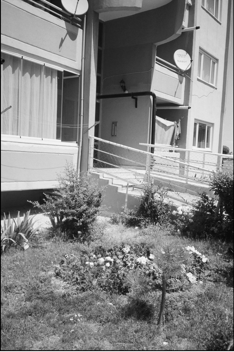
Resim 9: Yöneticinin çabası ile oluşturulan bahçe