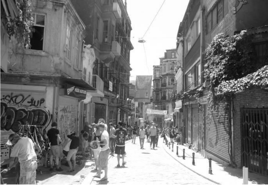
Resim 2: Galipdede Caddesi'nde turistlere yönelik hediyelik eşya satıcıları, 2011.