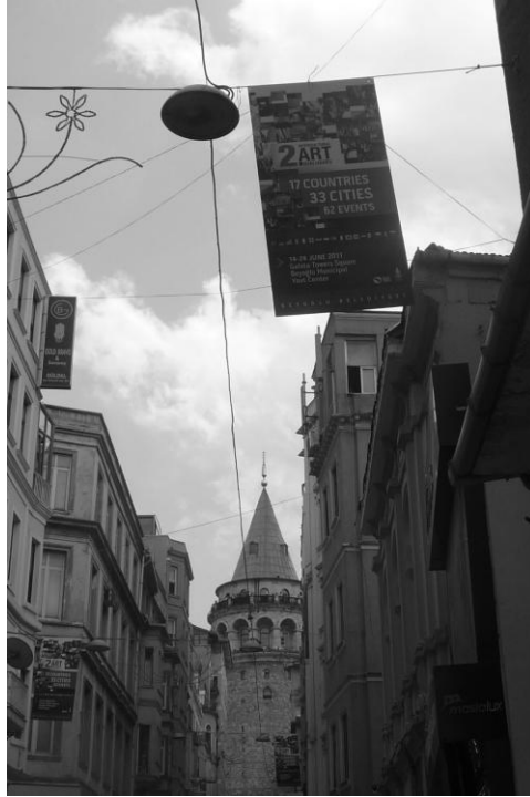
Resim 3: Galata'da etkinlik afişleri (Fotoğraf: Coşkun, 2011).

lata Tasarım Festivali, Beyoğlu Belediyesi'nin desteklediği girişimler arasındadır. Galata'daki bu etkinlikler sırasında, mekân olarak yıkılan binalardan geriye kalan boş alanlar veya Kuledibi Meydanı ve çevresi kullanılmaktadır (Resim 3).