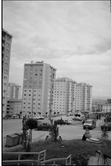
Resim 2: Karacaören genel görünüm

Sitenin planına bakıldığında, gecekondu halkının yapmaya alışık olduğu birçok faaliyet için yer yoktur. Örneğin, kadınların halılarını yıkayacakları ve kurutacakları, yatak yünlerini kabartıp havalandıracakları, kış yufkası/ekmek yapacakları alanlara site tasarımında yer verilmemiştir. Kadınların gecekondu önünde ya da bahçe içinde toplanmasının yaygın olmasına karşın, sitede buna imkân veren mekânlar da yoktur. Sadece çocuk oyun aletlerinin bulunduğu birkaç alan ve bu alanlarda bir iki kameriye mevcuttur. Bu durum çoğunlukla gecekonducularını bırakmak zorunda olan ailelerde sıkıntı yaratmış, gecekonducularına olan özlemi ve gecekonducularının yıkılmasından dolayı duydukları üzüntüyü körüklemiştir. Özellikle gecekonduadaki bahçe, doğaya olan yakınlık, hareket özgürlüğü ve az yoğunluklu fiziksel çevrenin getirdiği rahatlık çok aranmıştır.