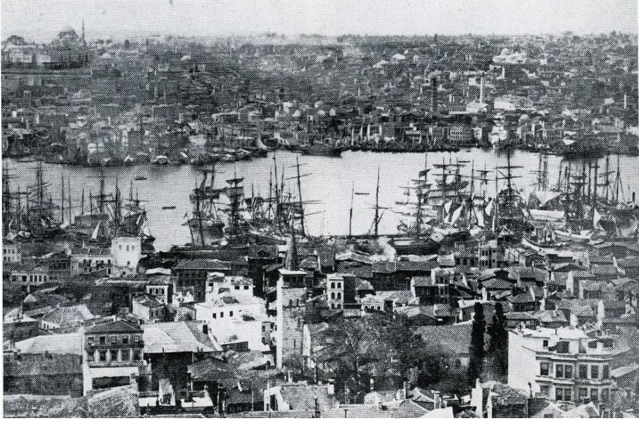
Resim 1: 19. yüzyılda Galata semti ve limana bakış.

Bölgenin en önemli tarihi eserlerinden biri Galata Kulesi'dir. Çevresinde yer alan sinagoglar; Rum, Ermeni, Süryani ve Gürcü kiliseleri azalan cemaatlerine rağmen günümüzde de işlevlerini sürdürmektedirler. 19. yüzyılın ikinci yarısından 20. yüzyılın başına kadar geçen sürede gerçekleşen yangınlara bağlı olarak Galata'daki ahşap konut dokusu ve sıkışık yol ağı hasar görmüş; fiziksel çevre değişime uğramıştır (Özyurt, 2007). Günümüzde, Kule ve çevresinde yoğunlaşan doku, büyük ölçüde 20. yüzyıl başlarına tarihlenen kâgir apartmanlardan oluşmaktadır (Öncel, 2010).