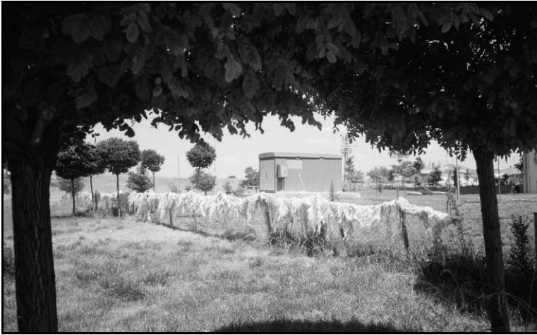
Resim 5: Kurutulan yünler

Sonuç, balkonlardan sarkan bisikletler, kaldırımlarda oturan kadınlar, boş alanlara ve hatta park edilmiş arabaların üzerine havalanması için serilen yünler, bina önlerinde yıkanan halılar olmuştur. Bu durum bir yandan insanların ‘dönüştürme gücü’nü ( agency ) mümkün kılması aç-