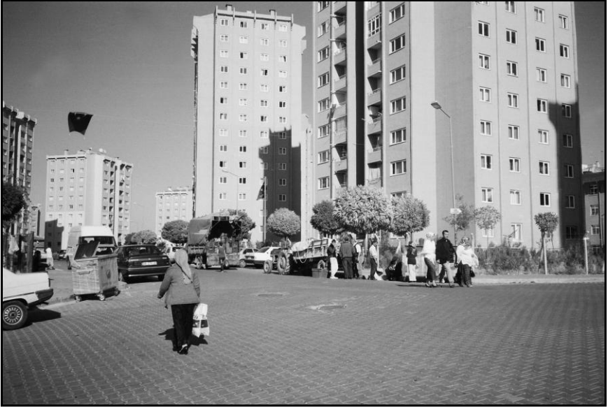
Resim 3: Kıracıören sitesi ana cadde

Siteye taşınalı dört yıl geçtikten sonra ne tür değişiklikler yaşanmıştır? Aşağıda bu konu irdelenmektedir.