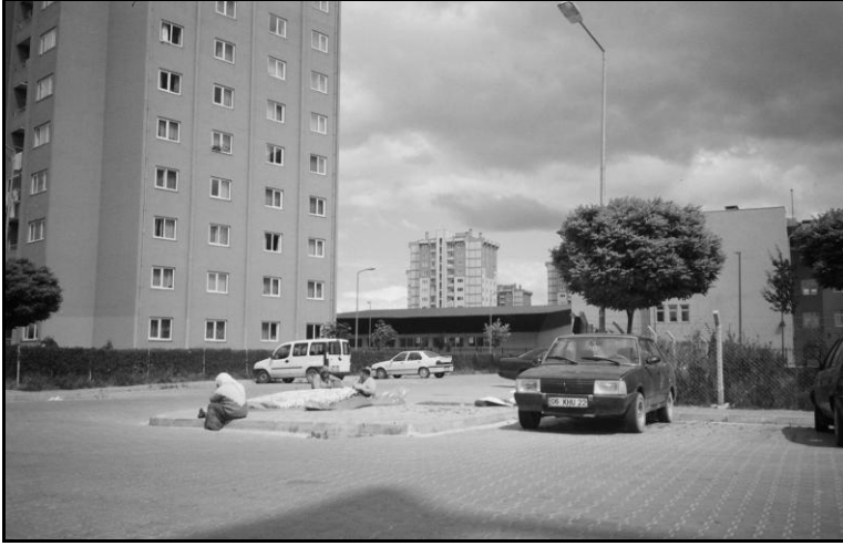
Resim 4: Sitede yatak diken kadınlar

aileler eski alışkanlıklarını yeni çevrelerinde de yapmaya başlamışlardır: “Bizim halkımız alışmış, herkes bildiğini okuyor.”