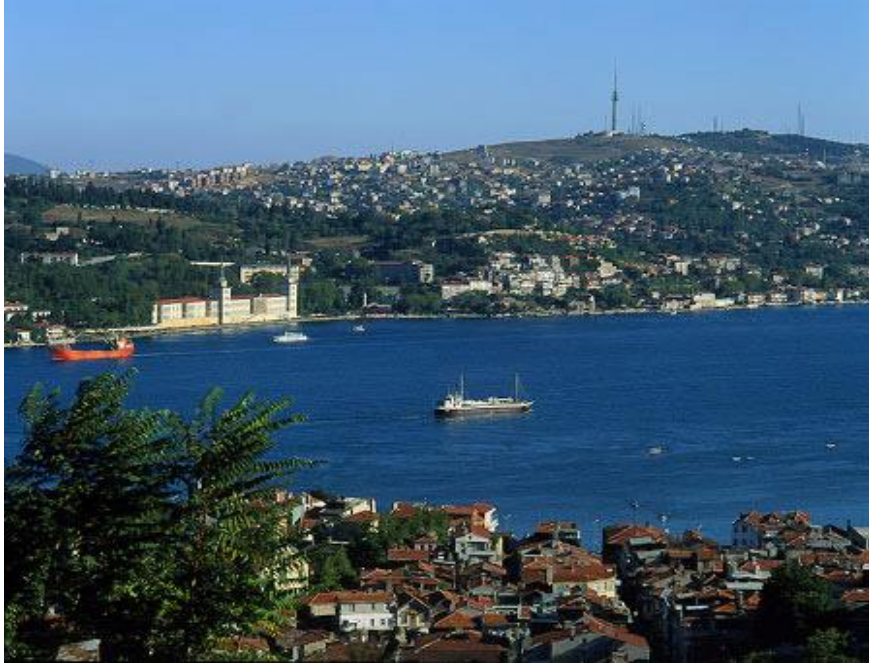
Resim 8. Boğaziçi'ndeki çarpık kentleşme

Anıtlar Yüksek Kurulu'nun en önemli kararlarından biri Boğaziçi'nin korunması için hazırlamış olduğu yasaydı. Kurulun getirmiş olduğu bir öneri ile birlikte, bütün Boğaziçi Bakanlar Kurulu kararıyla koruma alanı ilan edilmiş ve bu yasa ile birlikte Boğaziçi'ne yapılacak bütün inşaatların kurulun onayından geçmesi sağlanmıştır.