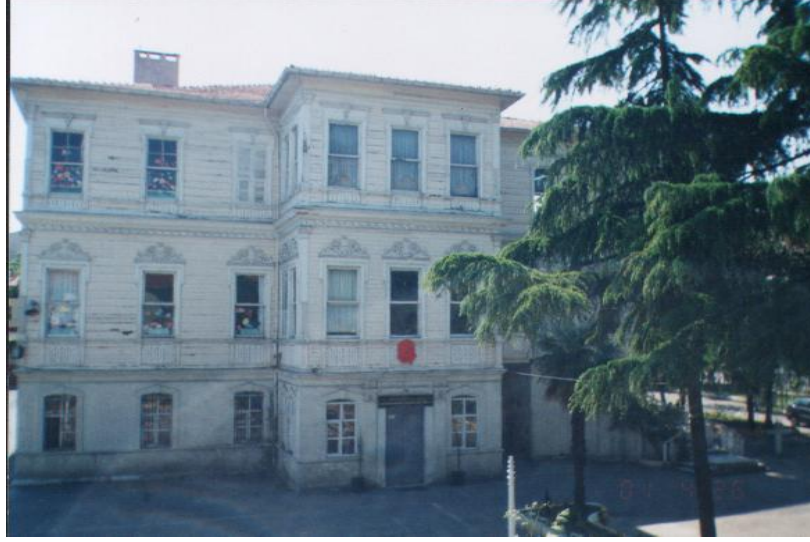
Resim 5. Fehime Sultan Yalısı Ön Cephe Görünümü

20. yüzyılın başlarında Balyan Usta tarafından yaptırılan Neo Barok ve Art Nouveau'nun güzel örneklerinden biri olan Ortaköy'deki Fehime Sultan (Gaziosmanpaşa) Yalısı, böyle bir rant kavgasına kurban gitmiştir. Yalı 22 Temmuz 2002 Cumartesi günü belirlenemeyen bir sebepten dolayı çıkan yangında kullanılamaz hale gelmiştir. Yangın öncesinde okulun bahçesinin, yasa dışı otopark olarak kullanıldığı iddiaları ile soruşturma başlatılmış, ancak sonuçlandırılmadan bu üzücü felaket meydana gelmiştir. Yalı bir süre enkaz halinde kalmış olup, bahçesi de maalesef 5 yıl süre ile otopark olarak kullanılmıştır. Kullanım hakkı Türk Hava Yollarına verilen yalı, restorasyona alınmıştır. Şüpheli bir şekilde yanan yalının polis tarafından yürütülen soruşturmasında sebep olan kişi ya da kişiler tespit edilememiştir.