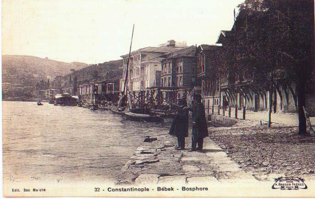
Resim 4. Boğaz'ın En Güzel Koylarından Biri Olan Bebek Koyu

Perihan, Sarıöz. . (1996) "Bir Zamanlar İstanbul", S.188