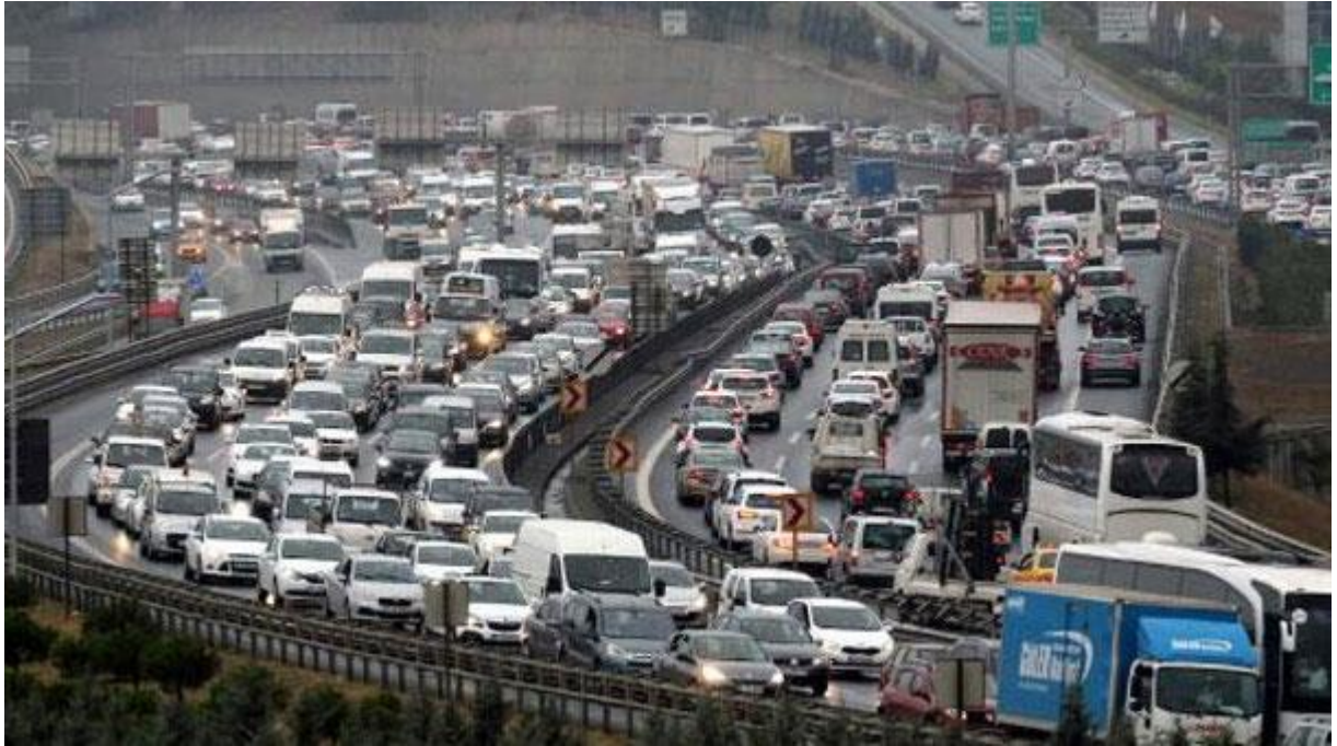
Resim 7. İstanbul'da Trafik Problemi

Yeni yollar çoğunlukla eski yapılar yıkılarak yapılmıştır. Yol genişletilmesi çalışması sırasında da birçok tarihsel anıt yok edilmiş, Boğaz kıyısındaki sahilhanelerin bir bölümü yıkılmıştır.