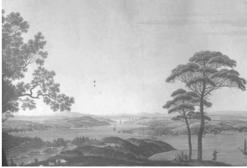
Resim 1. Melling, Dev Dağı'ndan Boğaz; Melling, Voyage Pittoresque... Pl. No:36

Boğaziçi, doğal biçimlenme ve coğrafya olarak, yeryüzü üstünde tek örnektir. Doğa burada iki kıtayı, tam ortadan ikiye ayırmış ve bu kıyılara özel bir biçim vermiştir. İstanbul'un konumundaki bu lüks, dünyanın hiçbir yerinde yoktur. İstanbul'da nüfusun istikrarlı olduğu zamanlarda meskenler geniş bahçeler içine oturulur, şehir yukarıdan bakıldığı zaman bir ormanın içine gömülmüş gibi görünürdü. (Ayvazoğlu, B. 2012. s. 44.). Bu kıyıları tarih boyunca elinde tutmuş olan güçlerin hiçbiri, onun güzelliğini anlayamamışlardır. Günümüze gelinceye kadar aşama aşama yok etmişlerdir.