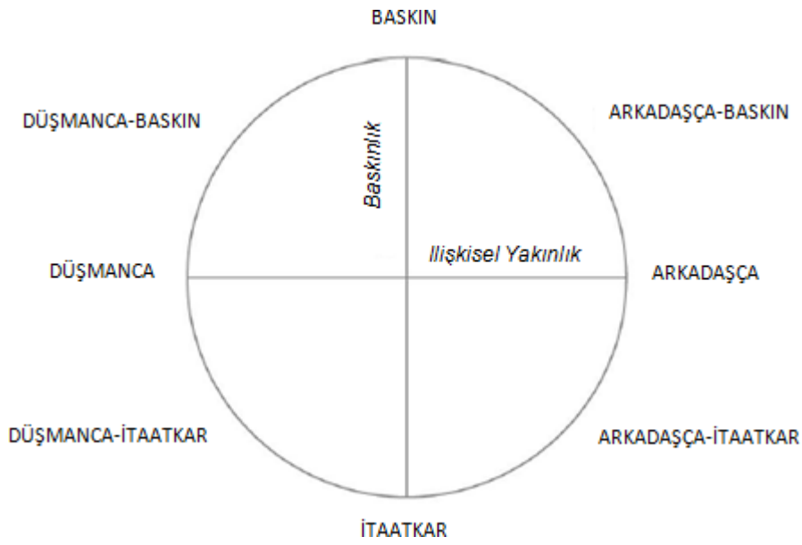
Şekil 1. Kişiler Arası Döngüsel Model (Akyunus ve Gençöz, 2016)