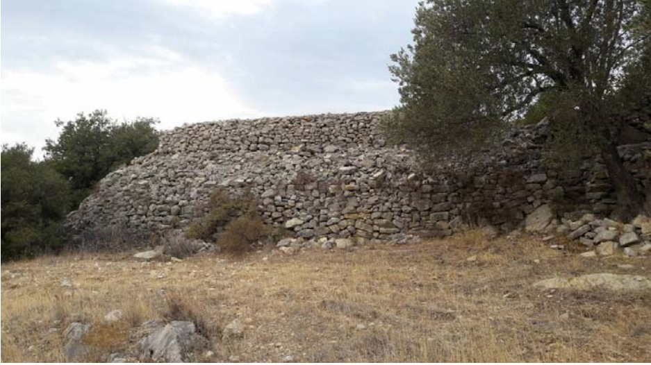
Fotoğraf: Tarla oluşturmak için toplanmış ve aynı zamanda üzüm sergi alanı olarak da kullanılmış bir taş yığını.

Arazilerin büyük bölümünün bağ üretimi için teraslamasının çok zor şartlarda gerçekleştiğini teras duvarları ve arazi içine toplanmış taş yığınlarının büyüklüğünden de anlamaktayız. Bunların varlığı günümüzde çeşitli öykülerle de beslenerek, o dönemde Rumların çok çalışkan ve becerikli insanlar olduğu yönündeki imajını sürdürmeye yaramaktadır. Dolayısıyla bu arazi duvarları ve taş yığınları, o dönemi yaşayan yaşlılardan dinlenen öykü ve değerlendirmeleri canlı tutmaya yarayan kültürel izler olarak varlığını sürdürmektedir.