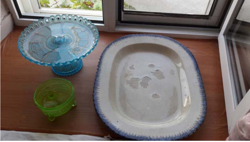
Fotoğraf: Pulaşka sırasında (Eylül 1922) elde edilen mutfak eşyalarından örnekler

Bu ve benzeri pek çok hatıra ve öyküyü kuşaklar boyunca bize kalakurya kilimleri, yoğurt kaseleri, tabaklar ve kadehler taşır. Onların yok olması, söz konusu hatıra ve olayların toplumsal hafızamızdan silinmesi tehlikesini de beraberinde getirmektedir.