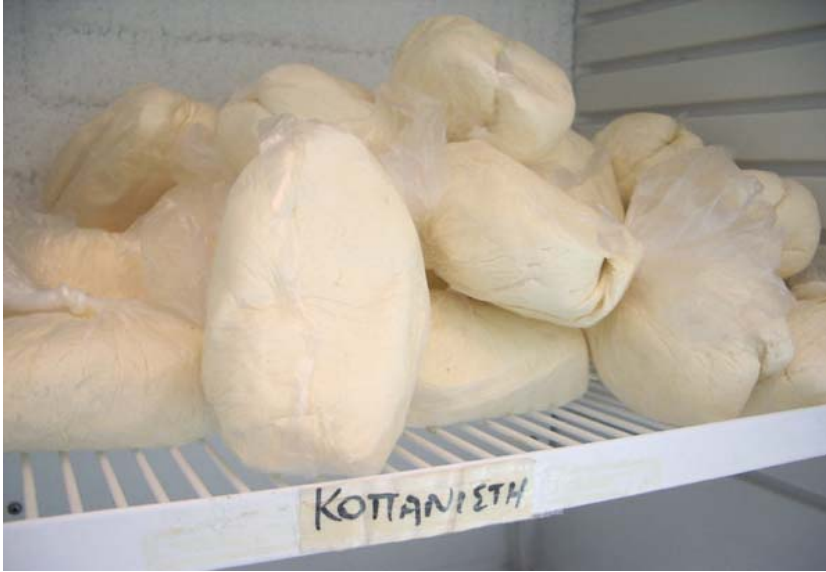
Fotoğraf: Sakız adasında bir market vitrininde kopanisti peyniri.

Mutfağa yansıyan kültürel miras ürünleri arasında en özel olanlardan biri Kopanisti peyniridir. Yunanca ezilmiş, dövülmüş peynir anlamına gelen bu peynir türü geçmişte Germiyan köyünde yaygın olarak üretilen ve tüketilen bir peynir türüydü.