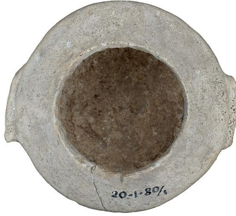
Şekil 3: Mermer hydria hazne kısmının tepeden görünümü (Fotoğraf: Kadir Kaba).