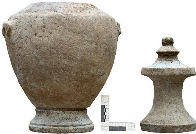
Şekil 2: Mermer hydria iki parçalı hali (Fotoğraf: Kadir Kaba).