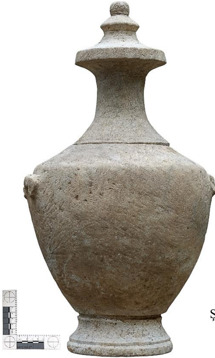
Şekil 1: Mermer hydria bütünleşik hali.

Zoroğlu, K.L. (2004). Hellenistic Pottery from Kelenderis. E Epistemonike Synanthese Giaten Ellenistike Keramike . Praktika, 299-310.