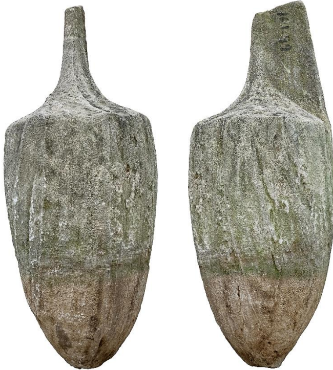
Şekil 4: Mermer lekythosun önden ve yandan görünümü