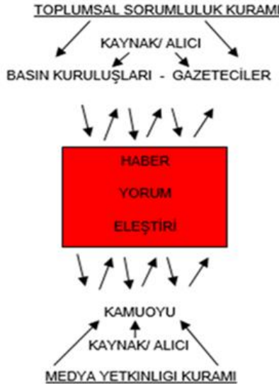
Şekil 1: İnternet Gazeteciliğinde Sorumluluk

Medya yetkinliği (medya okur-yazarlığı), medya karşısında, kişilerin uygun davranışlarda bulunabilmesi için, gerekli becerilere sahip olmalarını ifade etmektedir. Medya Yetkinliği Kuramı, medya yetkinliği kavramından ortaya çıkan bir kuramdır. Alman medya pedagogu Dieter Baacke, dört aşamadan oluşan bir medya yetkinliği kuramı ortaya koymuş ve yetkinlik kavramını medya ile ilişkilendirmiştir. Ona göre medya yetkinliği, eğitim ile değiştirilebilmektedir. İnsanların eleştirel düşünme ve argüman sunma becerilerini geliştirmeleri ve doğru yolu bulabilmeleri için, farklı becerileri öğrenmeleri gerekmektedir. Medya yetkinliği kuramı, tamamlanmışlığı ifade etmemektedir. Kişisel bakış açısına ve yönelimlere göre farklı tarzlarda düzenlenebilir ve genişletilebilir (Alver, 2006: 9-26).