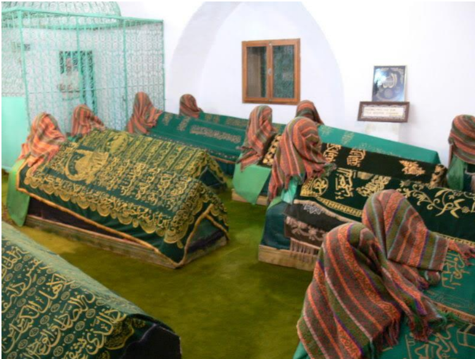
Şeyh Muhyiddin Efendi'nin (Soldan en başta) bulunduğu Şeyh Şaban-ı Veli Türbesi