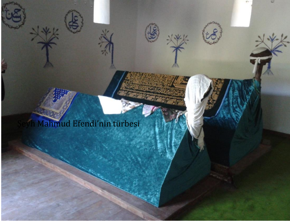
Şeyh Mahmud Efendi'nin türbesi