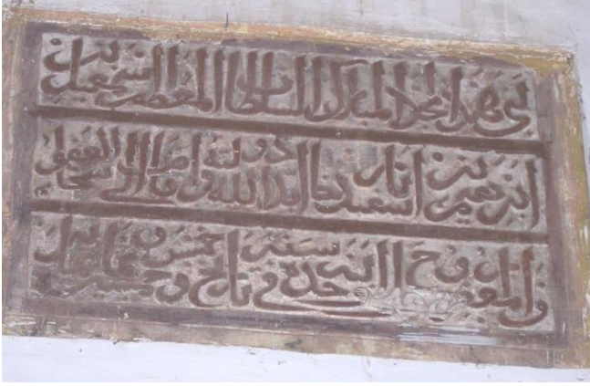
İsmail Bey Camiinin kitabesi