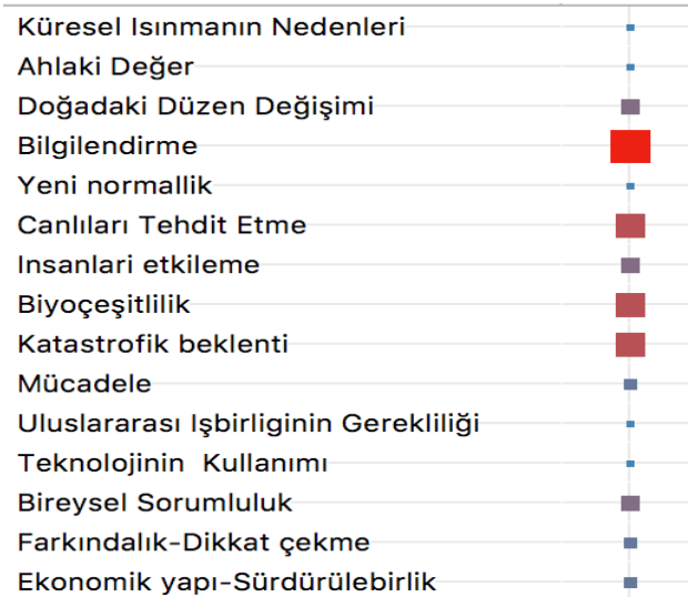
Tablo 2 Küresel Isınma ile İlgili Çerçevelerin Yüzdelerine Göre Oranları

İkinci tablo çerçeveleme dışında olgusal olarak da yer alan haberleri içermiştir. MAXQDA programının hesaplamalarında kare tablodaki kareler büyüdükçe haberlerden bahsetme sıklığı artmaktadır. Buraya kadar haber içeriklerinin temalarının sıklıkları anlatılmıştır. Sonraki bölümde bu haber içeriklerinin çerçevelenme biçimleri farklı altbaşlıklarla çerçeveler ve olgusal içerikler birleştirilerek aktarılacaktır.