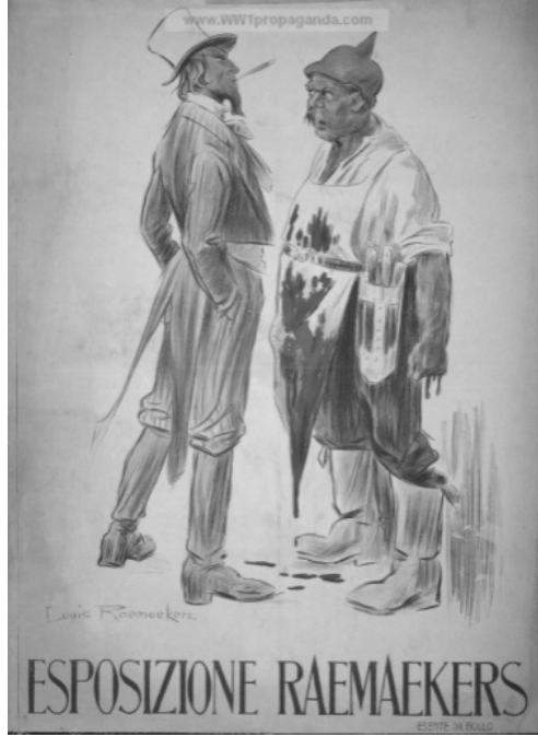
Resim 1: “Katliam” Konulu Propaganda Afışı

İtalyan propagandasında Almanların korkutucu ve katliam yapan kişiler olarak gösterilmesi İtalyan kamuoyunun Almanya ve Avusturya-Macaristan İmparatorluğu’na karşı birleşmesini amaçlamaktaydı. Nitekim Birinci Dünya Savaşında İtalya’nın en yoğun olarak savaştığı İttifak Devletleri Almanya ve Avusturya-Macaristan olmuştu. Birinci Dünya Savaşının en kritik döneminin yaşandığı 1917-1918 yılları arasında İttifak Güçleri İtalya’nın kuzeydoğusunu ele geçirmeyi başarmıştı. İtalya’nın kaybedilen topraklarını geri almasının ve İttifak Kuvvetleri’ni topraklarından çıkarması, ABD’nin 1917 yılında İtilaf Devletleri’nin yanında savaşa girmesi ile mümkün olacaktı. Nitekim Almanya, ABD kuvvetleri ile karşılaşabilmek için İtalya Cephesi’ndeki ağırlığını Batı Cephesi’ne kaydırmıştı. İtalya karşısında yalnız kalan Avusturya-Macaristan ise işgal ettiği toprakları elinde tutamamıştı. Bu süreçte İtalyan kamuoyunda ABD bir kurtarıcı olarak değerlendirilmeye başlandı.