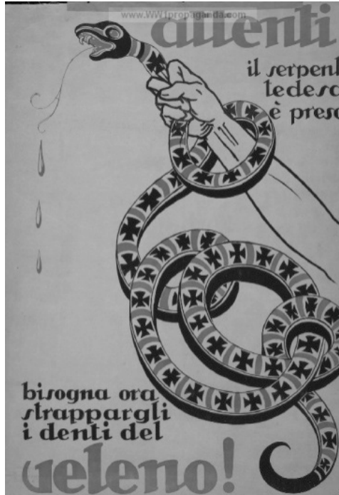
Resim 3: “Yılan” Konulu Propaganda Afişi

“Yılan” konulu propaganda afişi Barthes'ın düzenlam boyutunda ele alındığında, afişte bir elin, üzerinde haçlar bulunan bir yılanın boynunu sıktığı görülmektedir. Görsel kodlar içerisinde yılanın dili dışarıdadır ve ağzından üç damla kan akmaktadır. Sunum kodları içerisinde yılanın can çektiği izlenimi uyandırılmaya çalışılmıştır. Afişin üstünde İtalyanca “Attenti! Il serpente tedesco è preso!/Dikkat Alman yılanı yakalandı!” altında ise “bisogna ora strappargli i denti del veleno!” Şimdi zehirli dişlerini sökmeye ihtiyaç var!” yazılı kodları bulunmaktadır.