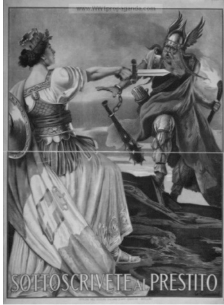
Resim 2: “Barbar” Konulu Propaganda Afişi

İtalya Krallığı, kendisini Roma İmparatorluğu’nun mirasçısı olarak görmekteydi. Bu açıdan Roma İmparatorluğu’nun geçmişini ve mirasını sahiplenmekteydi. Roma İmparatorluğu, Germen Kavimleri ile sürekli olarak mücadele halindeydi. Germen Kavimleri, Batı Roma İmparatorluğu’nun yıkılmasında önemli bir rol oynamıştır. Diğer yandan İtalya’nın Germen Kavimleri tarafından yağmalandığına, Roma İmparatorluğu’nun bölgede inşa ettiği düzeni yıktığına dair inançlar mevcuttu.