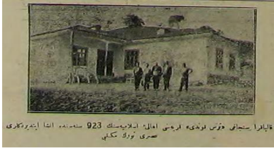
Resim 1. Kalyakra (Pazarcık) Sancağı “Kuş Kondu” Karyesi Ahali-i İslamiye’sinin 923 senesinde inşa ettirdikleri asri Türk Mektebi (20 Ağustos 1928, Romanya )

Aynı tarihli gazetenin arka sayfasında yer verilen haber “Mektep Kitapları” başlığı altında olup; “Bükreş Maarif nezaretinin 19 Eylül 1928 tarihli ve (117072) numrolu müsademesiyle Dobruca İslam mekteplerinde tedris edilmek üzere İstanbul’a sipariş etmiş olduğumuz mektep kitapları gelmiştir. (Romanya, 15 Teşrin-i Evvel 1928) Yeni Türk harfleriyle yazılmış en son tadilatı hazırlamağa ve imla kâğıdı dahi mevcuttur...” denilmektedir. ( Romanya, 15 Teşrin-i Evvel 1928).