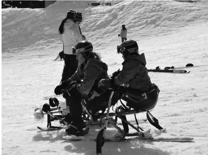
Şekil 3. Vancouver Mount Grouse'da bir engellinin kayak keyfi

"Özürlü bireylerin sportif etkinliklere katılımı toplumun dikkatini özürlü bireylere çekerek olumsuz tutum ve davranışların değişmesinde önemli bir rol oynayacaktır. Sportif etkinlikler yoluyla özürlüler toplum içinde işbirliği, paylaşım ve kişilerarası ilişkilerin kurallarını öğrenirler. Sportif etkinlikler özürlü bireylerin yaşam kalitesini yükseltir ve kendilerini gerçekleştirebilecekleri bir sosyal ortam yaratır. Tüm bu özellikleri kapsamına alan bir etkinlik olarak spor, özürlülere yaşam boyu önerilmektedir." (Gür, 2001: 23)