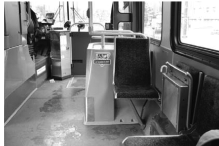
Şekil 2. Vancouver'da bir engellinin otobüsteki yeri