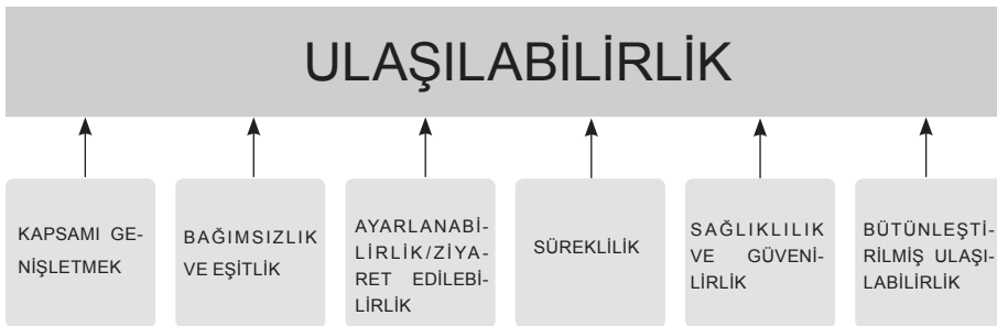
Şekil 1. Ulaşılabilirlik ilke ve ölçütleri

Vancouver Kanada’nın Britanya Kolumbiyası eyaletinde bulunan bir şehirdir. Batı Kanada’nın en büyük, ülkenin de üçüncü büyük metropolüdür. Büyük Vancouver Bölgesi’nin (Greater Vancouver Regional District) şehirlerinden biridir. Amerika sınırına 40 km uzaklıktadır.