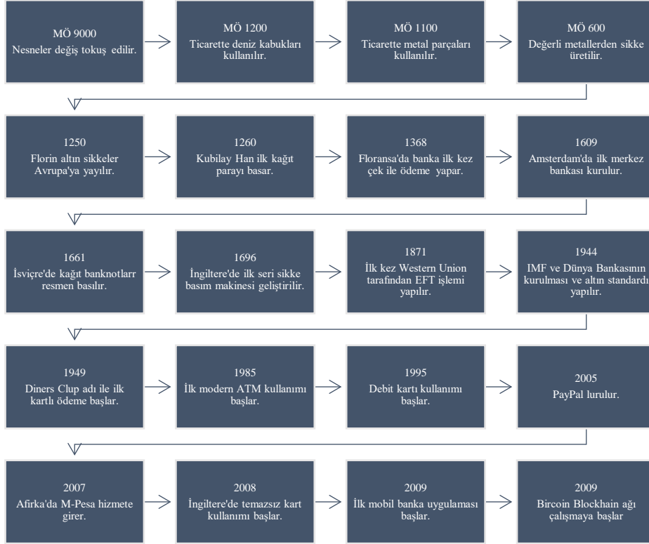
Şekil 1. Paranın Tarihçesi

Hızlı bir değişim ve gelişim sürecine girmiş olan ve geleceği ile ilgili farklı teorilerin ortaya atılmaya devam eden paranın tarihi serüvenini bir şekil ile şöyle gösterebiliriz: