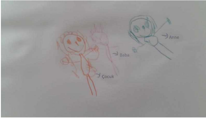
Şekil 2. Çocuğa ait bana bir aile çiz resmi

Resim analizi çalışmaları sonucunda, annesi ile olan ilişkisinin çoğunlukla çatışmalı olduğu ve annesine ilişkin kaçınan tutumlar sergilediği sonucuna ulaşılmıştır.