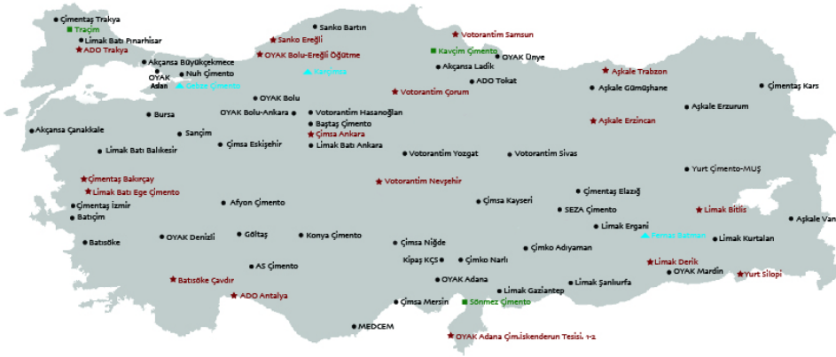
Harita 1: Türkiye Çimento Üretim Haritası