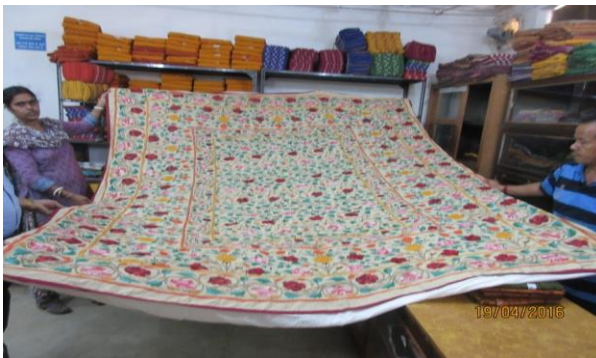
Figure 1- Cotton handloom material at Amarkutir, Santiniketan

Cotton weaving especially printed fabrics in Khadi cotton is quite popular in Santiniketan. Various designed and printed fabrics are available in shops in the Santiniketan area. Traditional Bengal handloom weavers are there in rural locations of Bengal including selected units of Birbhum.