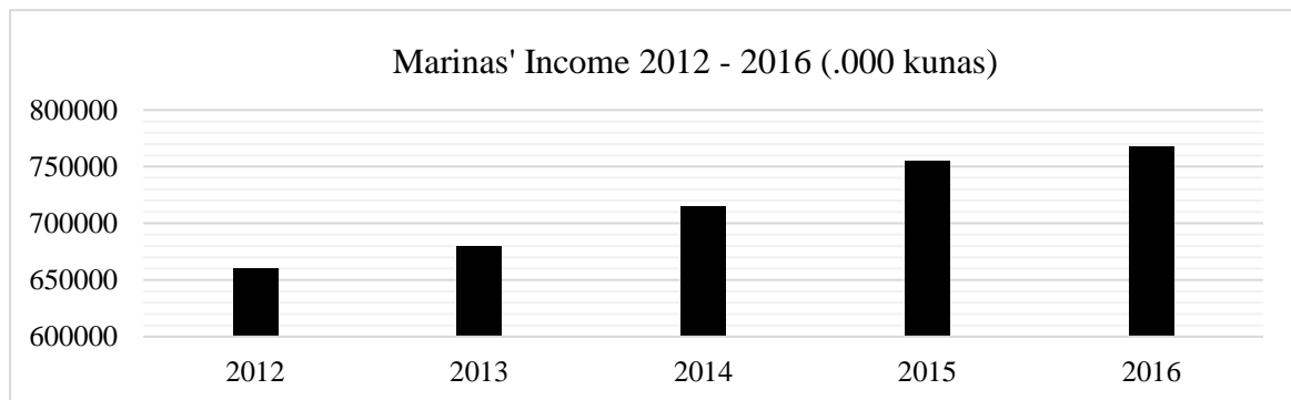
Figure 1. Marinas' Incomes for the Period 2012 – 2016 in Croatia (.000 kunas).

The continuous increase in the number of marinas leads to increasing marinas' incomes, as seen in Figure 1. In 2012 Croatian marinas generated 660 million kunas, while in 2013 this amount reached up to 680 million, displaying an increase of 3%. This increase continued during 2014 with a total income of 715 million kunas. In 2015 the total marinas' income amounted to 755 million kunas and, finally, 768 million kunas during 2016, showcasing an increase of 16,3% for the period 2012 – 2016.