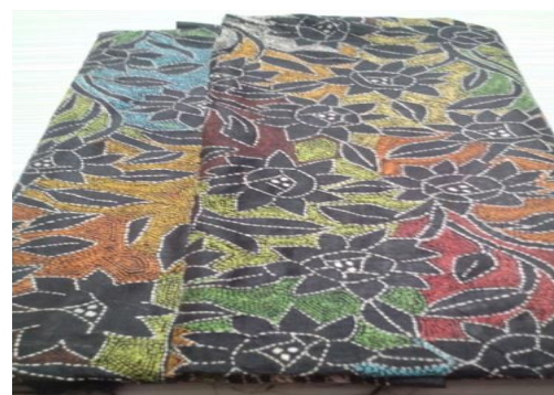
Figure 2- Kantha Stitch Saree of Santiniketan