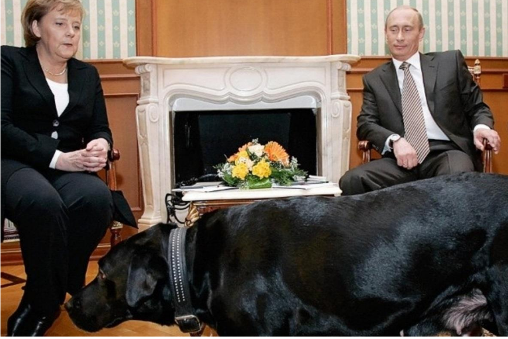
Fotoğraf 1: 2007 yılında Soçi’de A. Merkel ve V. Putin’in görüşmesi (“That time Putin terrified Merkel with his dog, and other reasons they won’t get along at G20 summit”, 2017)

doğduklarını ve Berlin Duvarı'nın yıkıldığı dönemde temel siyasi deneyimlerini kazandıklarını vurgulamıştır.