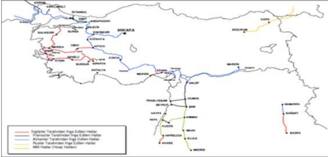
Harita 1: Osmanlı Devleti'nde 1918'e kadar inşa edilen demiryolları 40