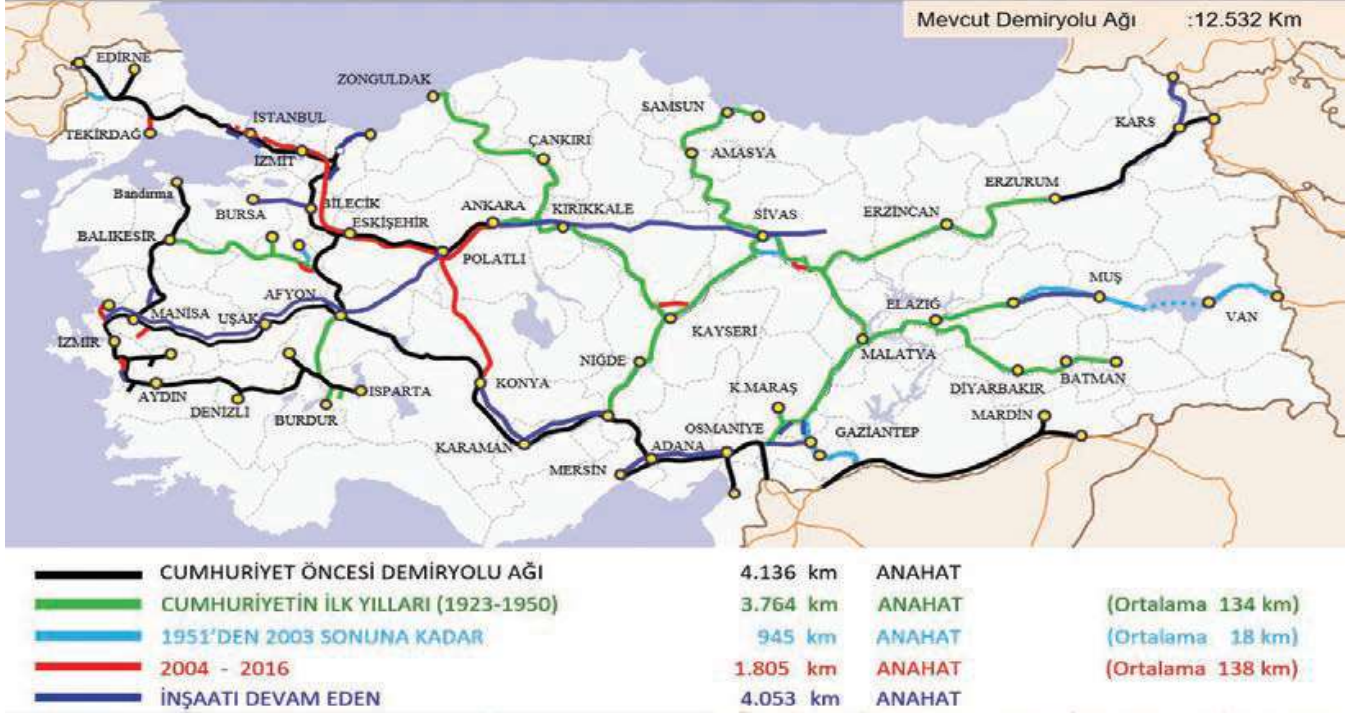
Harita 4: Demiryollarımızın mevcut durumu 114

Tüm bu tesisler sadece bir fabrika olarak değil aynı zamanda Mustafa Kemal Atatürk'ün modern sanayi tesisleri fikrine uygun olarak her türlü sosyal ve kültürel birimleriyle hayata geçirilmiştir. 113