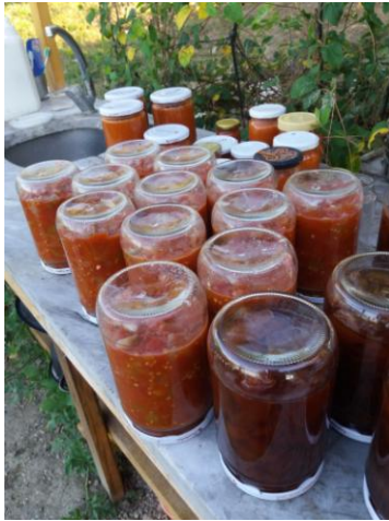
Foto dizisi 1: Kişisel ve kolektif üretim ürünlerinden örnekler (Soldan sağa: Konserve/reçel, keçi peyniri, kurutulmuş sebzeler)