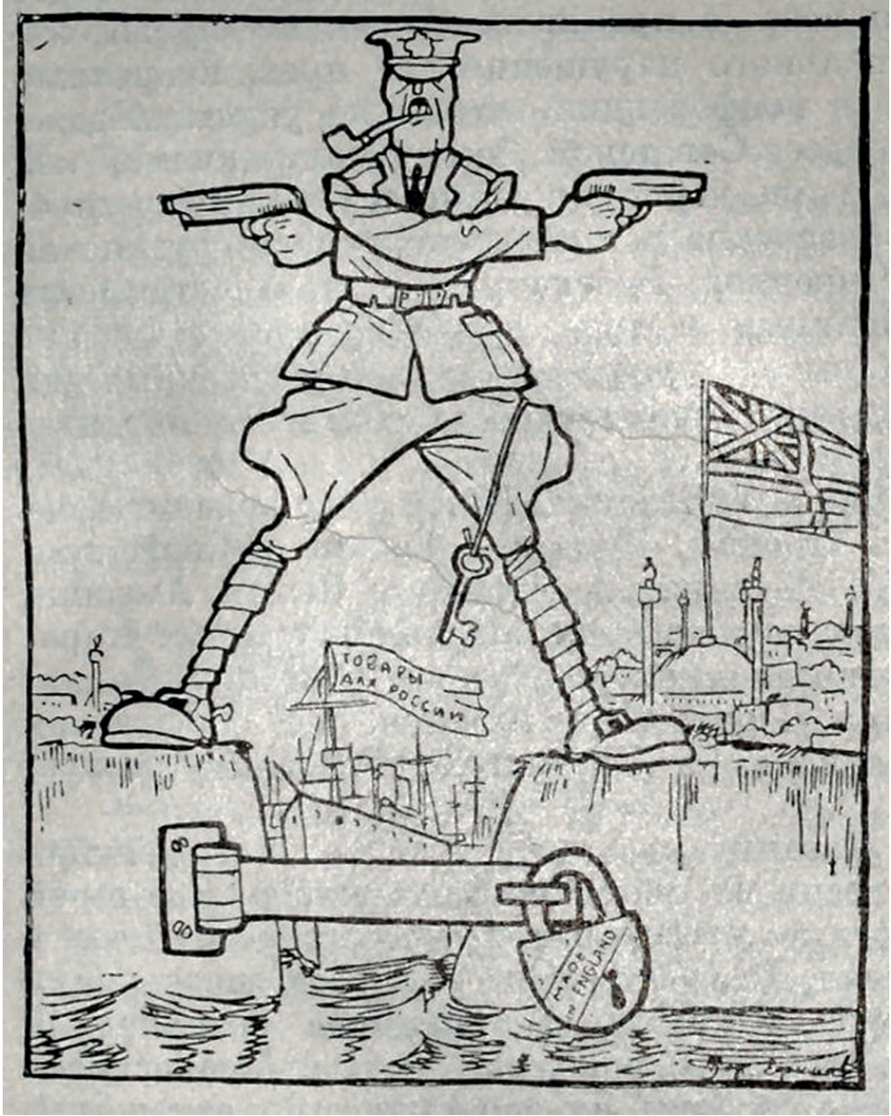
Ek 2. Boğazlar Meselesi üzerine İngiliz Projesi. B. Yefimov'un çizdiği karikatür, 1923.