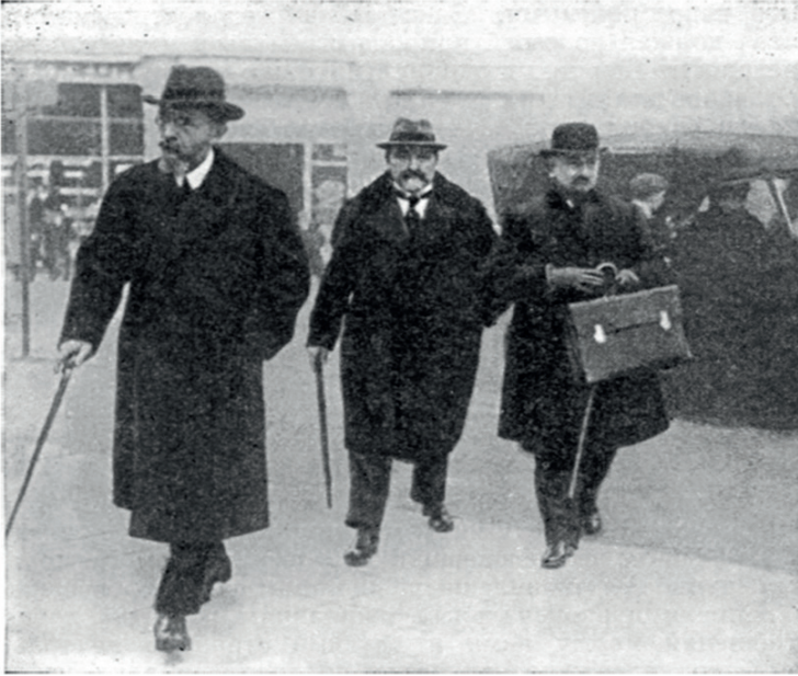
В. В. Боровский, Я. Х. Давтян и Г. В. Чичерин в Лозанне —1922 г.