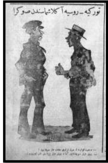
Karikatür 7 Yeni Gün, 24 Kanunuevvel 1925

Cumhuriyet'in ilk yılları Türkiye'nin aktif bir dış politika izlediği dönemdir. Yıllardır süren savaş ortamının sona ermesinin ardından, Türkiye Cumhuriyeti çeşitli antlaşmalar imzalamıştır. Antlaşmaların imzalanmasının ardından, henüz çözüme kavuşmamış bazı sorunlar karşısında Türkiye'nin eli güçlenmiştir. Milli Mücadele yıllarından gelen birikimle birlikte Cumhuriyet'in ilk yıllarında Rusya ile bir yakınlaşma olmuştur. 1925 yılının sonlarında bu yakınlaşma, imzalanan bir antlaşmayla resmileşmiştir. Antlaşmanın imzalandığı tarih son derece önemlidir. Milletler Cemiyeti'nin 16 Aralık 1925 tarihinde Musul konusunda Türkiye aleyhinde karar almasından bir gün sonra, Türkiye ve Rusya arasında Dostluk-Saldırmazlık Antlaşması imzalandı 55 . Yaşanan bu gelişmelerin ardından Yeni Gün gazetesinde Türk-Rus ilişkilerinin önemini gösteren "Türkiye-Rusya Anlaşmasından Sonra" başlıklı bir karikatür yayımlanmıştır 56 :