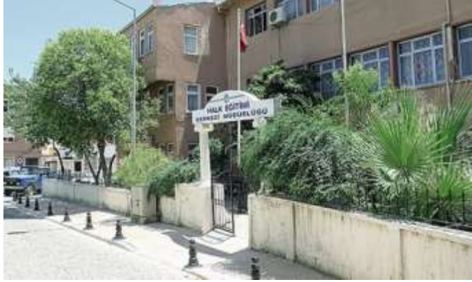
Sinagogların ve Alliance Okulunun arsası üzerinde inşa edilen Milas Halk Eğitim Merkezi Müdürlüğü.

Mahallesi sınırları içerisinde yer alan büyük bir arazi üzerinde inşa edilmişlerdi. Her iki kurumun arsaları üzerinde bugün, Milas Halk Eğitim Merkezi Müdürlüğü yapısı bulunmaktadır 26 . Bu yapı, 1972 yılında yapılmıştır.