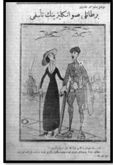
Karikatür 8 Yeni Gün, 10 Kanunuevvel 1925

Türkiye Musul konusunda kararlı olduğunu göstermek için askeri müdahale hazırlığını her zaman gündemde tutmuştur. Karikatüristler, olası askeri operasyonlara ilişkin çizimler yapmıştır. "Her Şeyin Fevkinde Vatan Aşkı" başlıklı karikatürde genç bir adam savaştan endişe duyan sevgilisinin "Harp olursa aşkımız ne olacak?" sorusunu "O zaman bütün gençlerin, bütün gençliğin yalnız bir tek aşkı kalacak: düşmandan intikam" şeklinde yanıtlamıştır 57 . Görüldüğü gibi Musul meselesinin silahlı bir şekilde çözülme ihtimali kamuoyunun gündeminde tutulmaya çalışılmıştır.