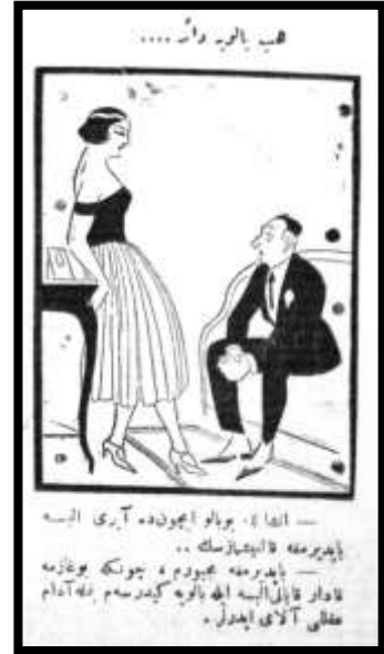
Karikatür 2 Yeni Gün, 10 Kanunusani 1926

Karikatüristlerin kıyafet konusunda üzerinde durduğu konulardan birisi kadınların yeni kıyafetlere verdiği önemdir. Kıyafetlere verilen önemin boyutu öylesine büyüktür ki,