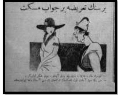
Karikatür 1 Yeni Gün, 7 Teşrinievvel 1925

Karikatürlerde en sık işlenen konu kadın kıyafetleridir. Kıyafet konusu üzerinde bu kadar çok durulmasının temel nedeni, Türk kadınının çağdaşlaşma serüveninin içinde yer alıyor olmasıydı. Geçmişten gelen birçok gelenek birer birer yıkılıyor ve Türk devrimi kadını prangalarından kurtarıyordu. Kıyafet moda olmanın ötesinde, çağdaşlığın göstergesi olarak kabul ediliyordu. Kıyafet meselesinin ele alındığı karikatürlerde açık bir şekilde modernleşme karşıtları hedef alınmaktadır. Şapka takan bir kadınla fes takan bir erkeği konu edinen bir karikatür çağdaşlaşma serüvenini gözler önüne sermektedir 34 :