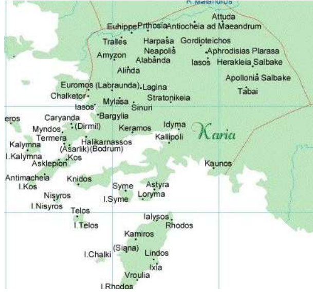
I. Antik Caria sınırlarını ve bölgedeki Antik kentleri gösteren haritadır. http://www.arkeolojidunyasi.com/bolgeler/karia.html , (Erişim Tarihi: 28.11.2019).