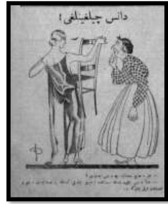
Karikatür 5 Yeni Gün, 22 Teşrinievvel 1925

Karikatüristler, gençler ve çocukların dansa olan meraklarını konu edinmiştir. Okula yeni başlayacak bir çocuk kendisine sorulan en fazla hangi derse çalışacaksın sorusuna “spor ve dans derslerine” yanıtını vermiştir 48 . Bir başka karikatürde genç bir kız babasının dans