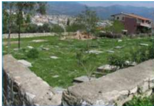
Sodra Dağı eteklerindeki Milas Yahudi Mezarlığı.