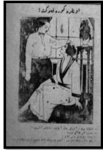
Karikatür 3 Yeni Gün, 25 Ağustos 1925