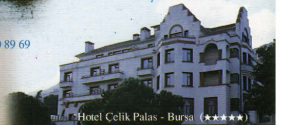
Hotel Celik Palas - Bursa (★★★★★) Phone: 224. 233 38 00 Fax: 224. 236 19 10