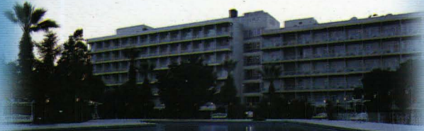
Grand Hotel Efes - Izmir (★★★★★) Phone: 232. 484 43 00 Fax: 232. 441 56 95