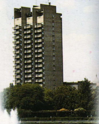
Hotel Stad - Ankara (★★★★) Phone: 312. 310 48 48 Fax: 312. 310 89 69