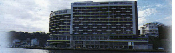
Grand Hotel Tarabya - Istanbul (★★★★★) Phone: 212. 262 10 00 Fax: 212. 262 22 60

We welcome you to our multi-star comfort.