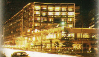
Hotel Macka - Istanbul (★★★★) Phone: 212. 234 32 00 Fax: 212. 240 76 94