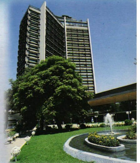
Grand Hotel Ankara (★★★★★) Phone: 312. 425 66 55 Fax: 312. 425 50 7