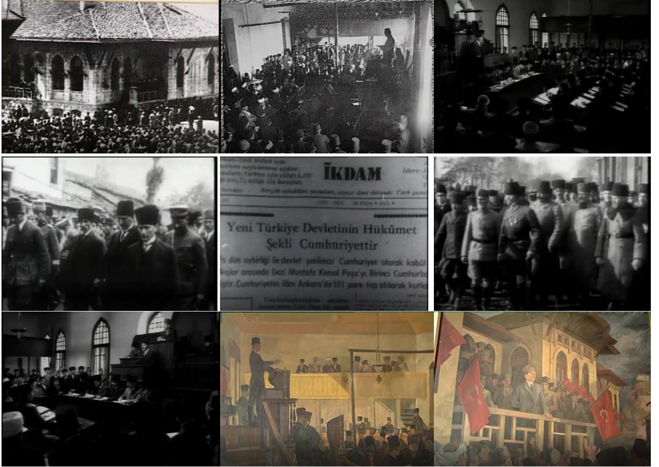
Albüm 4. Türkiye Büyük Millet Meclisi'nin Açılışı ve Halkın Coşkusu

milletvekillerinin yemin ettiğini, 338 milletvekilinden ancak 115'inin ilk toplantıda olabildiğini söyler. Meclisin en yaşlı vekili olan Sinop milletvekili Şerif Bey'in geçici başkanlığa seçildiğini, Şerif Bey'in açılış konuşmasını yapmasından sonra kürsüye Mustafa Kemal'in geldiğini, Mustafa Kemal'in genel durum hakkında açıklamalar yaptığını söyler. Yıldırım konuşmasının devamında, Mustafa Kemal, oy çokluğuyla Türkiye Büyük Millet Meclisi Başkanlığı'na seçildiğini, aynı zamanda da yeni hükümetin başkanı olduğunu söyler. Bu yeni yönetimin Türkiye Büyük Millet Meclisi hükümeti adını aldığını ifade eder. (Bu yeni yönetim Türkiye Büyük Millet Meclisi hükümeti adını aldı anonsu ile görüntüye İkdam gazetesinin konu ile ilgili haberi girer.)