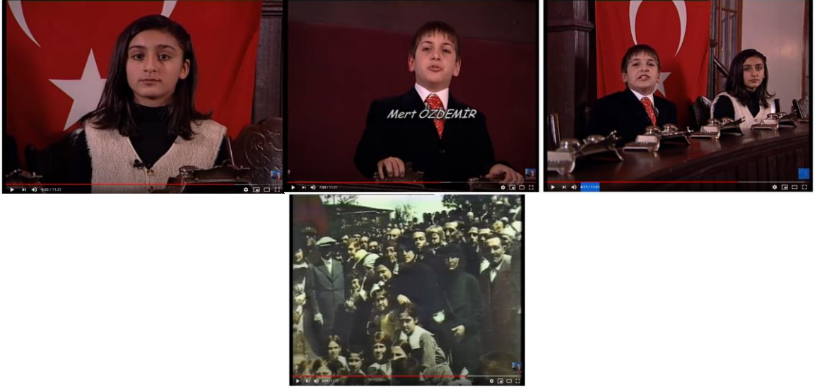
Albüm 6. Türkiye Büyük Millet Meclisi'nin Açılış Coşkusu

Albüm 6'da Çişel'in ve Mert'in görüntüleri istikbalimizin, meclis kürsüsü bağımsızlığımızın, halk bayram coşkusunun ifade edildiği gösterilenlerdir (Tablo 6).