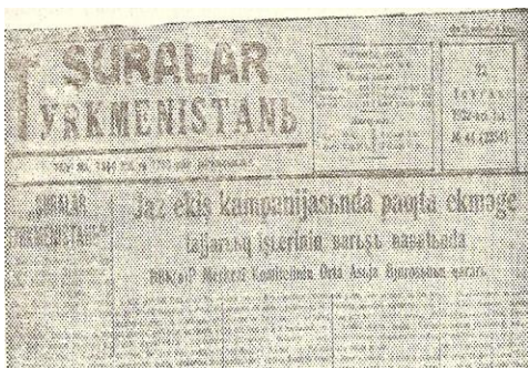
Ek-2: “Şuralar Türkmenistanı” gazetesini. (Latin alfabesinde)