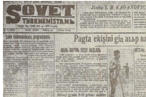
Ek-4: “Sovet Türkmenistanı” gazetesini. (Kırlı alfabesinde)