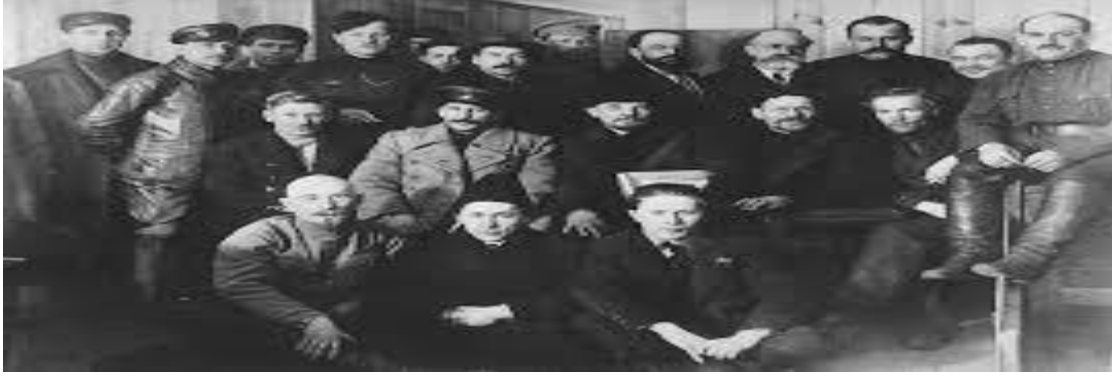
Lenin, Stalin, Troçki, Galiev (üst sırada) yol arkadaşlarıyla.